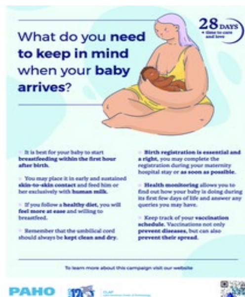
Figure 2. Poster pour la campagne « 28 Days, Time to Care and Love »

Source : Organisation panaméricaine de la Santé. The 28 days campaign - newborn health. Washington, DC : OPS ; 2022 [consulté le 2 septembre 2022]. Disponible sur : https://www.paho.org/en/campaigns/28-day-campaign-newborn-health .