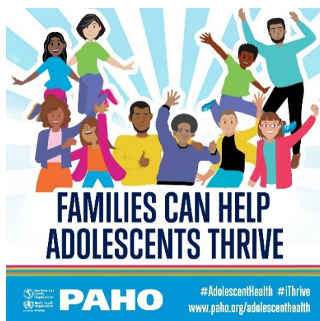
Figure 3. Carte de média sociaux pour le programme des Familles fortes