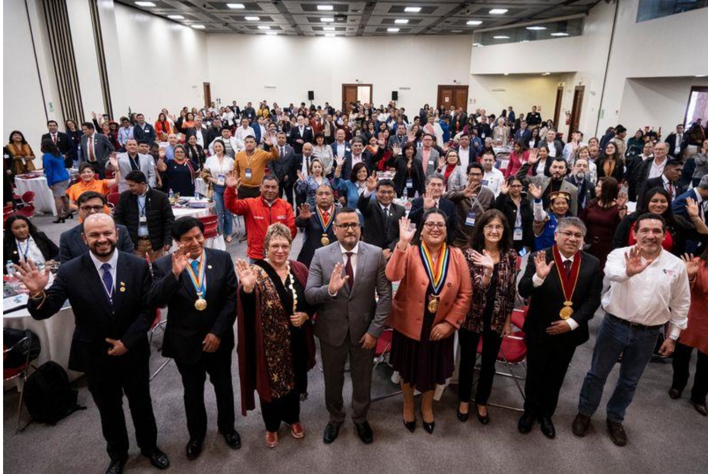
Encuentro regional en Cusco, 24 y 25 octubre de 2024