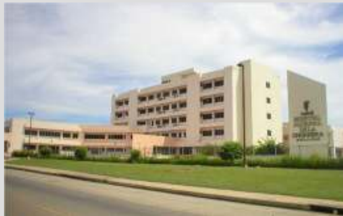
HOSPITAL REGIONAL NICOLÁS A. SOLANO

3 Policlínicas CSS 6 Centros de Salud (11)