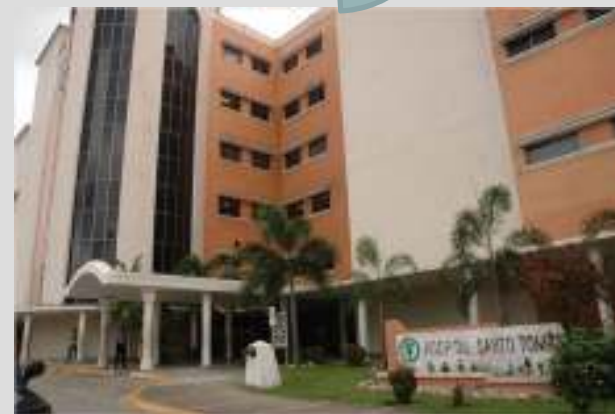
HOSPITAL SANTO TOMÁS