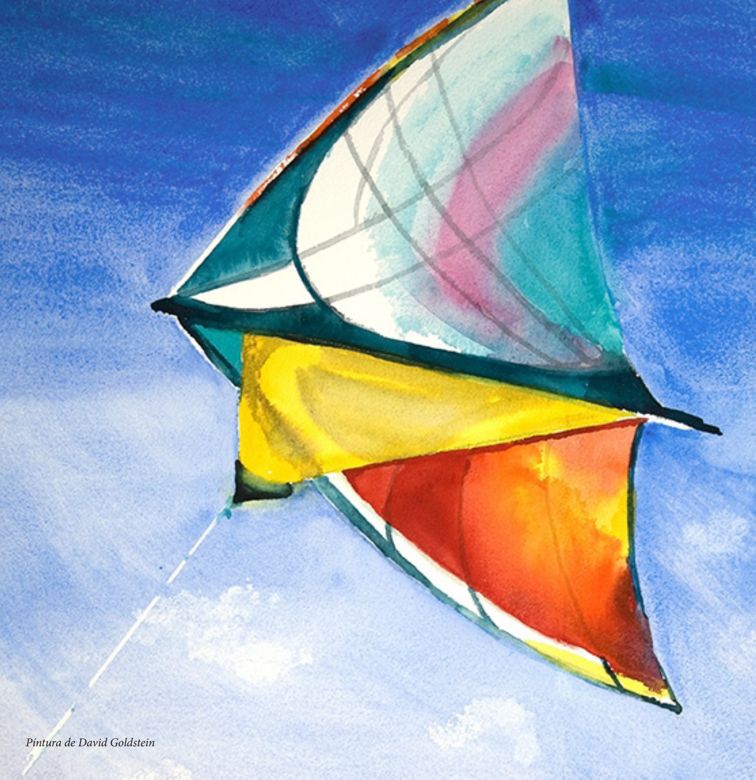
Pintura de David Goldstein