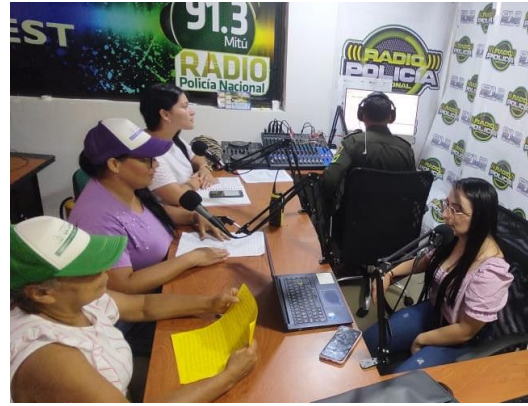
Información en Salud con enfoque diferencial