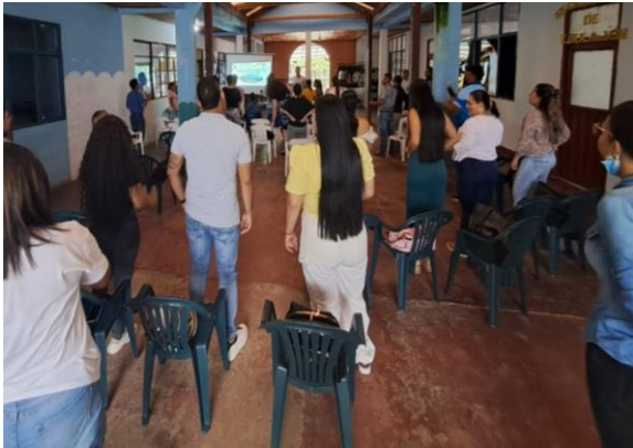
Encuentros grupales, de trabajo con PcD