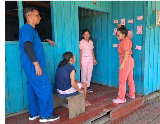
Visita Domiciliaria: (visitas y seguimiento)