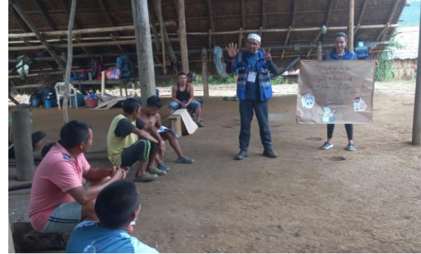
Educación en Casa: psicoeducación de factores de riesgos