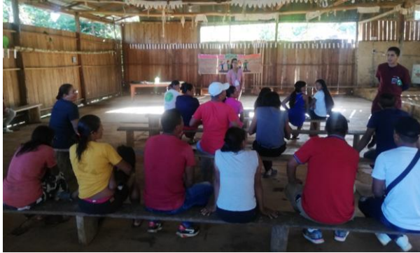
Concertación con las autoridades tradicionales