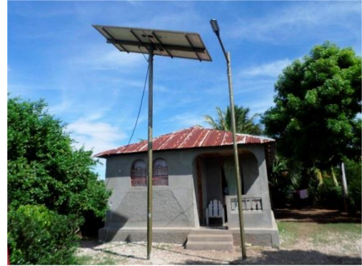
Paneles solares.

El 25 de Junio de 2015, el artículo “ Control de la transmisión de rabia por perros en Haití: no hay tiempo que perder ” ( Control of dog mediated human rabies in Haiti: no time to spare ) fue publicado en la revista de acceso abierto PLOS Enfermedades Tropicales Desatendidas (PLOS Neglected Tropical Diseases). Debido a la reciente historia de Haití y el objetivo de la OPS de “Eliminar la transmisión de rabia por perros en las Américas para el año 2015” se inició una misión en 2013 para evaluar las capacidades y el impacto de la vigilancia de rabia y programas de control en Haití utilizando el apoyo técnico por la OPS y el apoyo de recursos por Brasil para controlar esta enfermedad endémica. El estudio también evaluó los esfuerzos coordinados por socios nacionales e internacionales como el Ministerio de Agricultura y el Ministerio de Salud Pública y Población de Haití, y el Centro de Control y Prevención de Enfermedades (CDC) estadounidense. Este artículo es un paso crucial en la evaluación del estado actual de la rabia y por tanto para realizar recomendaciones informadas para el futuro. La fotografía inserta muestra la necesidad de un consistente suministro eléctrico para asegurar que las vacunas se mantengan a la temperatura apropiada, lo que es un obstáculo en Haití.