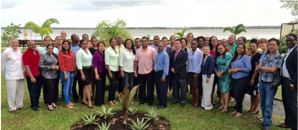
Participantes del taller.

Servicio de Salud Regional, las Misiones Medicas, la Universidad Anton de Kom y la Asociación de Salud Pública de Surinam.