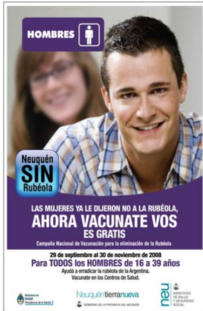
Afiche- Provincia Neuquén