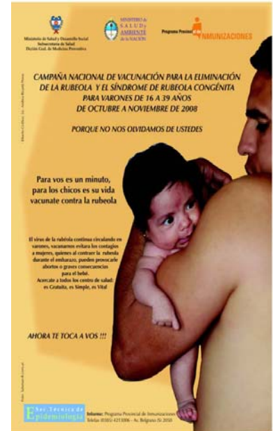
Afiche – Provincia Santiago del Estero