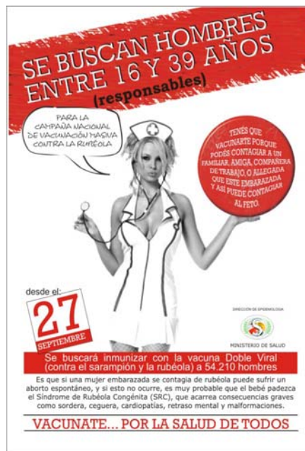
Afiche – Provincia La Rioja