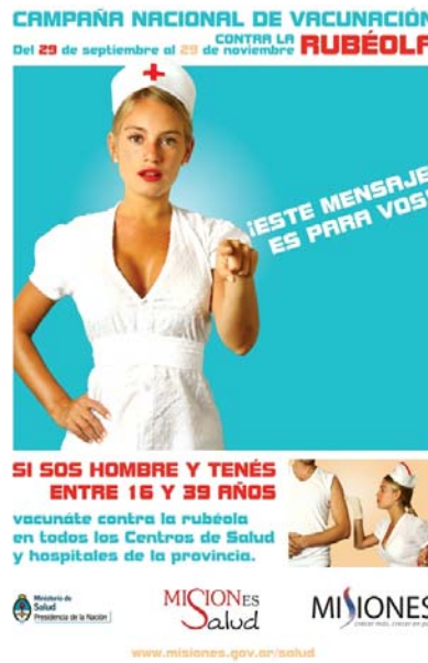
Afiche- Provincia Misiones