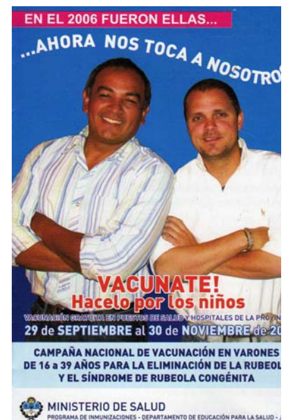
Afiche – Provincia Jujuy