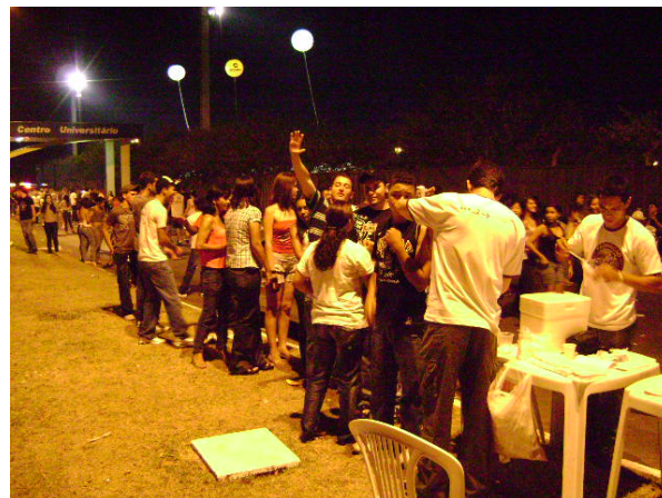
Seguidores de la popular cantante Claudia Leitte acuden al puesto de vacunación ubicado en Varzea Grande, Matto Grosso, Brasil minutos antes de iniciarse el concierto