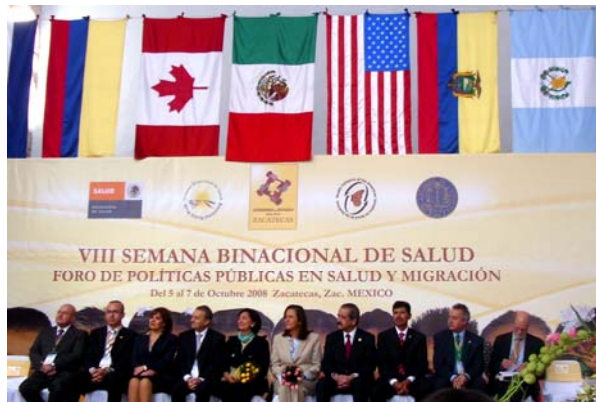
Autoridades nacionales y del Estado de Zacatecas participan en la ceremonia de reconocimiento