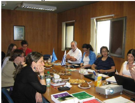
Mesas de Diálogo 2