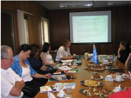
Mesas de Diálogo 1

nudos críticos, brechas y retos para la re-orientación y definición de políticas, programas y servicios de salud 6 .