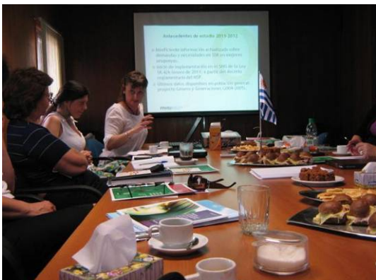
Mesas de Diálogo 3