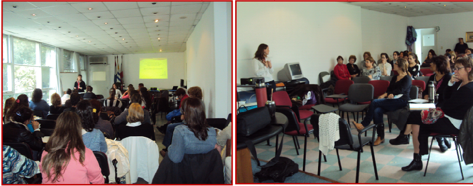
Curso Red de Atención Primaria, Montevideo.