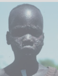
PKDL/ Post-Kala azar Dermal

Rio de Janeiro, Brasil, 9-10 diciembre 2008