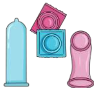
Preservativo masculino o femenino, también conocido como condón