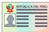
Carné de extranjería (CE)