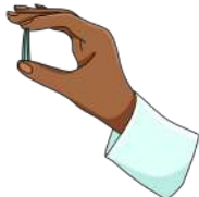
Implantes debajo de la piel