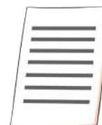
Permiso temporal de permanencia