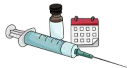
Injectables de 1 mes y de 3 meses