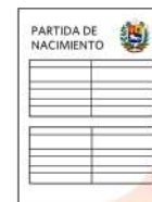
Partida de nacimiento