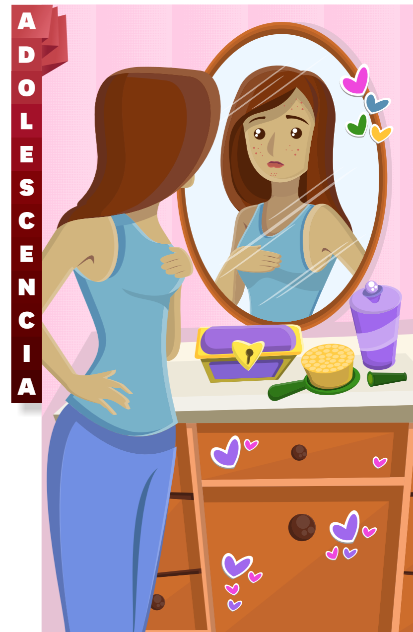
Postal inicial con las restantes once detrás