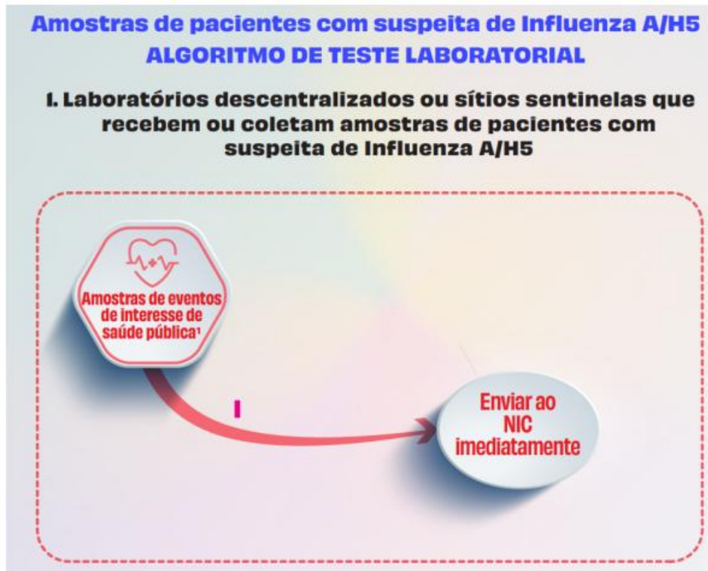
Figura 1. Fluxo de amostras de casos suspeitos de Influenza A(H5) em unidades sentinelas e laboratórios descentralizados.