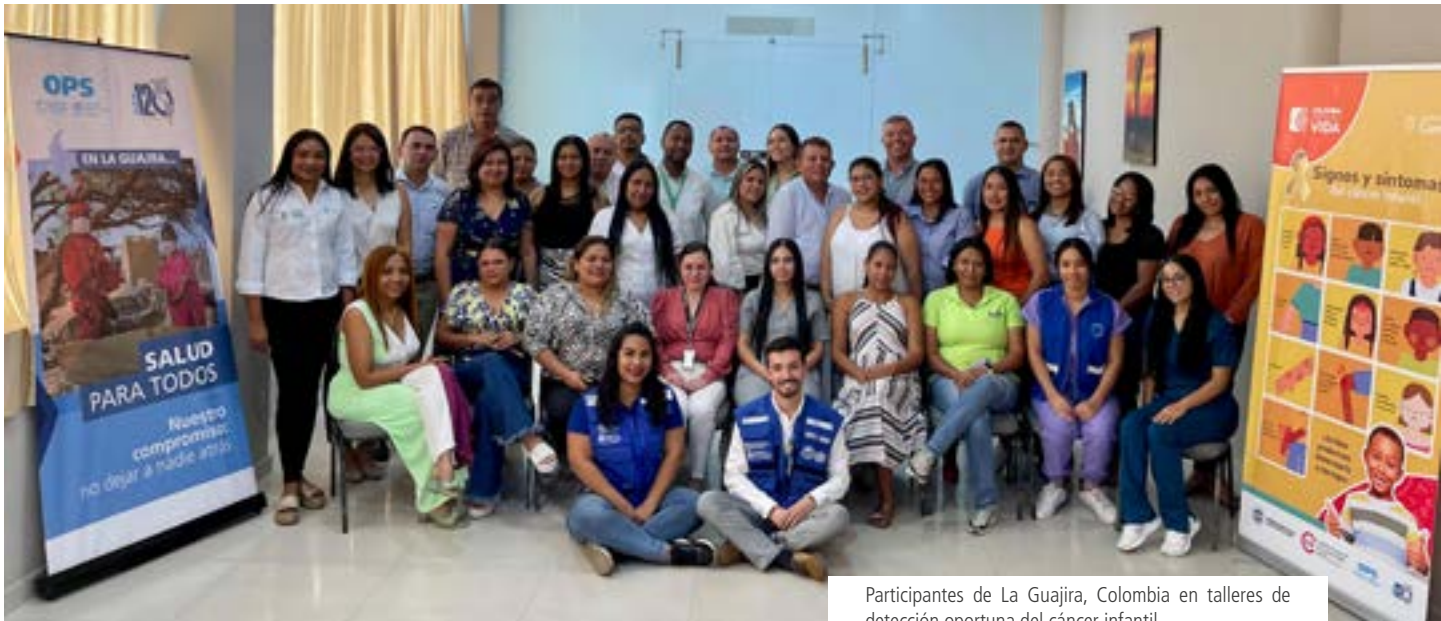
Participantes de La Guajira, Colombia en talleres de detección oportuna del cáncer infantil.

Conocer y estar alerta para identificar los signos y síntomas del cáncer infantil es crucial para iniciar el camino hacia la curación y la supervivencia. Aunque el cáncer infantil no se puede prevenir en la gran mayoría de casos, se pueden lograr altos índices de supervivencia y una buena calidad de vida.