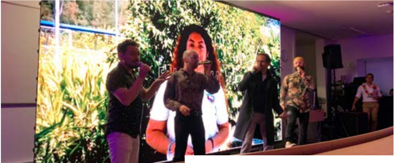
Actividad de lanzamiento de la campaña "Razones para Vivir" en Bogotá, Colombia.

La Organización Panamericana de la Salud OPS/OMS Colombia lideró la campaña 'Razones para Vivir', una iniciativa para generar conciencia ciudadana sobre los factores protectores asociados a la prevención de la conducta suicida, identificados por los habitantes de los diferentes territorios del país.