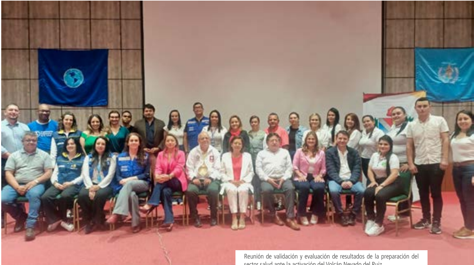
Reunión de validación y evaluación de resultados de la preparación del sector salud ante la activación del Volcán Nevado del Ruiz.