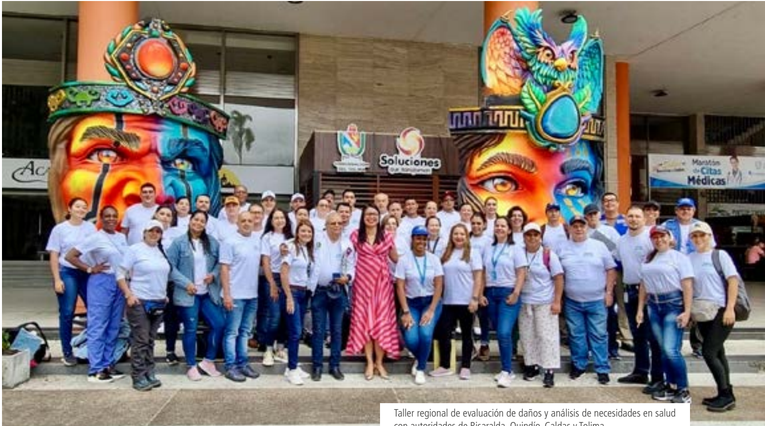
Taller regional de evaluación de daños y análisis de necesidades en salud con autoridades de Risaralda, Quindío, Caldas y Tolima.