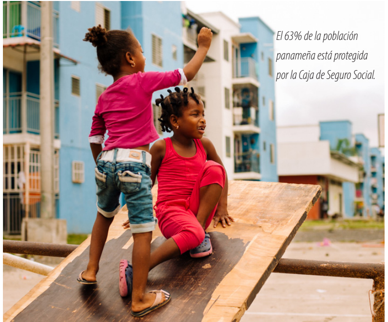
El 63% de la población panameña está protegida por la Caja de Seguro Social.

En marzo de 2020, Panamá contaba con 9,151 camas disponibles, lo que representa una tasa de disponibilidad de camas en el país era de 2.1 por 1,000 habitantes. De estas, 4,636 pertenecen al MINSa y 3,735 a la CSS. Del total de camas disponibles, el 70% son para hospitalización (26).