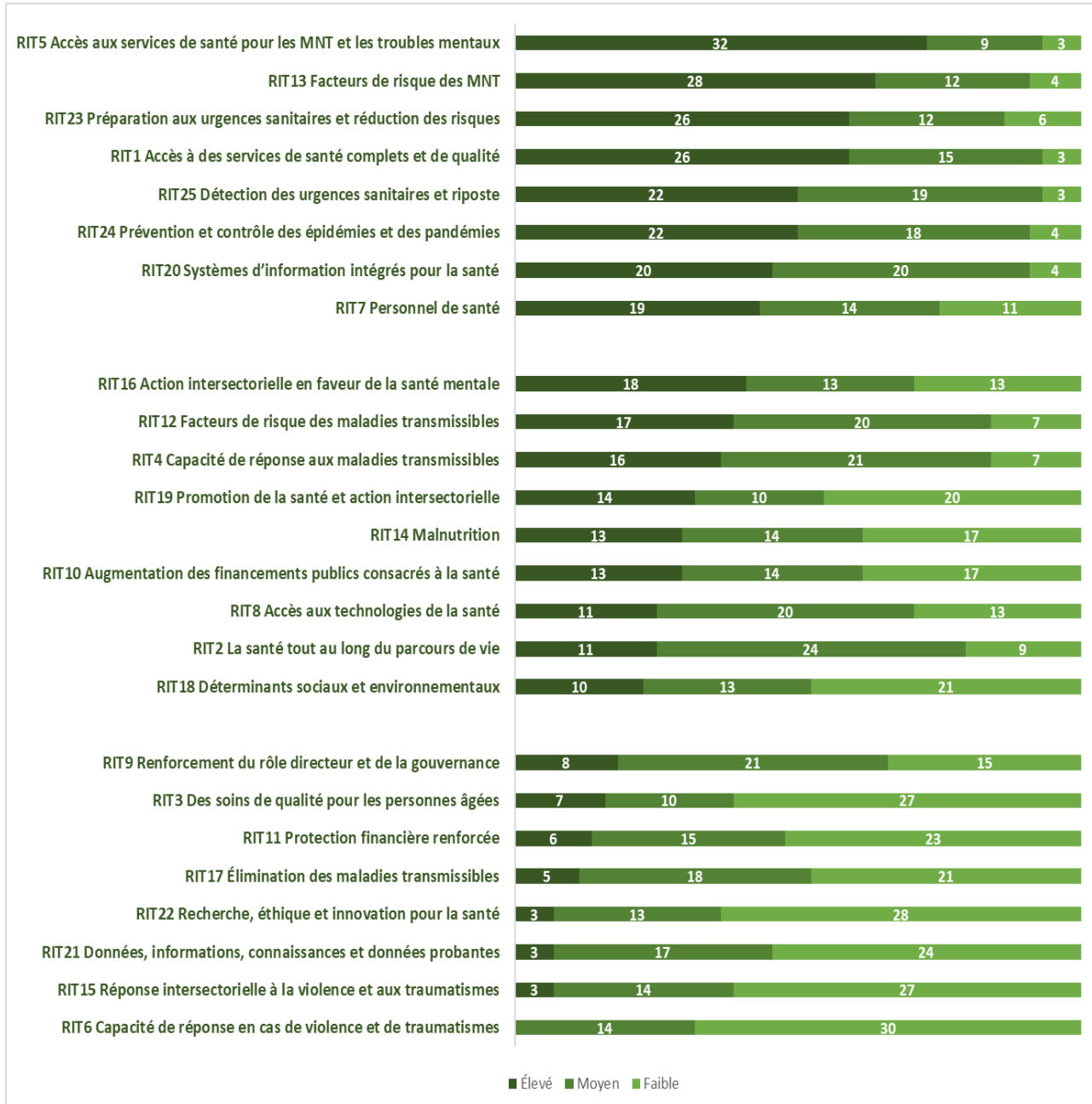
Figure 1. Résultats consolidés de l'établissement des priorités pour le budget programme 2024-2025 (Nombre de pays et territoires par niveau de priorité pour chaque résultat intermédiaire)

Note : les résultats intermédiaires 26, 27 et 28 ont été exclus en raison de la nature institutionnelle de leur champ d'application.