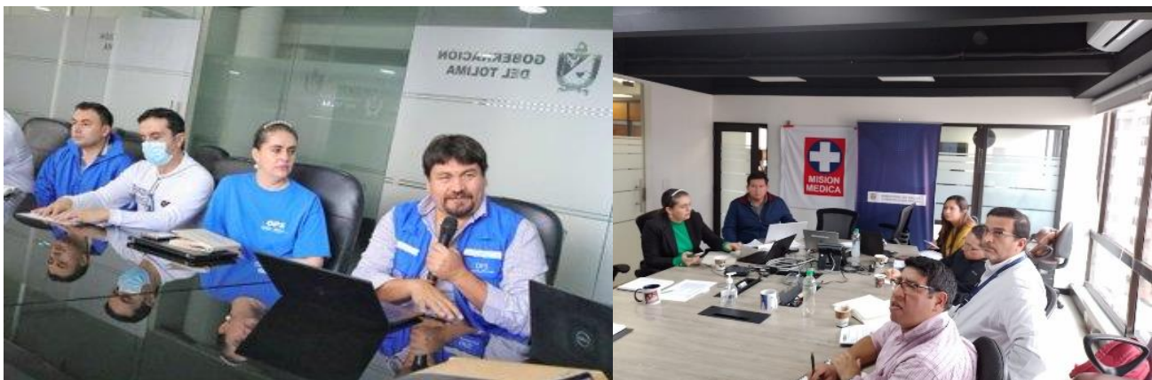
Ilustración 4. Imagen de la reunión entre OPS Colombia, la oficina de gestión territorial emergencias y desastres OGTED del MSPS y los CRUEs departamentales