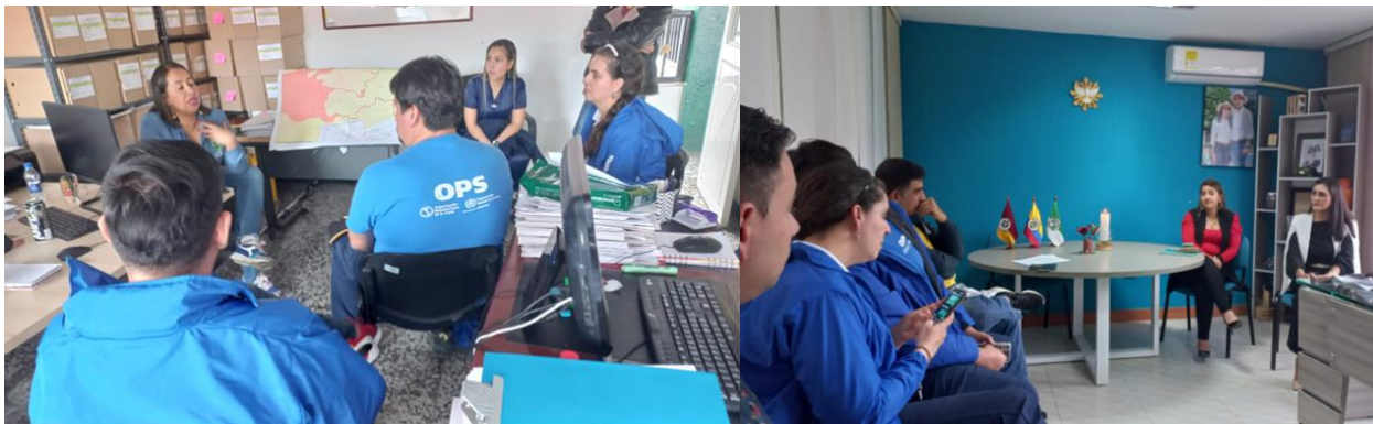
Ilustración 3. Imagen de la reunión entre OPS Colombia y las alcaldías de los municipios de Villa Hermosa y Casa Blanca