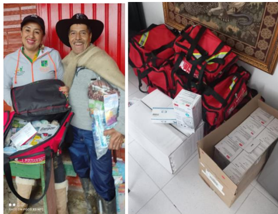
Ilustración 5. Entrega de Kits de primeros auxilios y tapabocas N95/quirúrgicos de tres capas, para distribución entre la comunidad y los organismos de socorro.