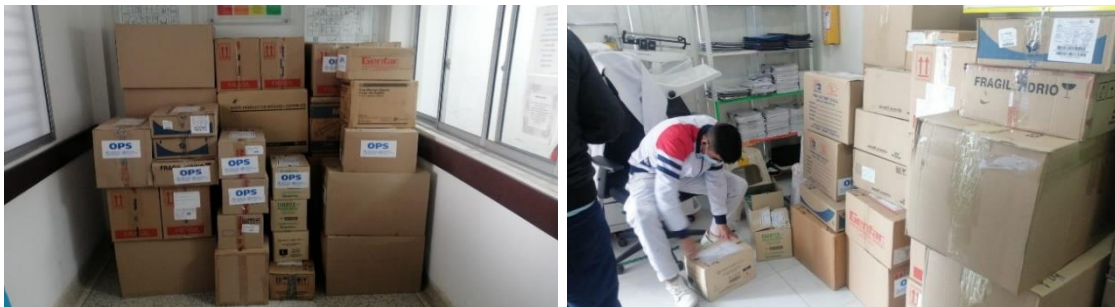
Ilustración 5. Entrega de medicamentos en Hospitales de los municipios de Cass Blanca y Murillo, Tolima