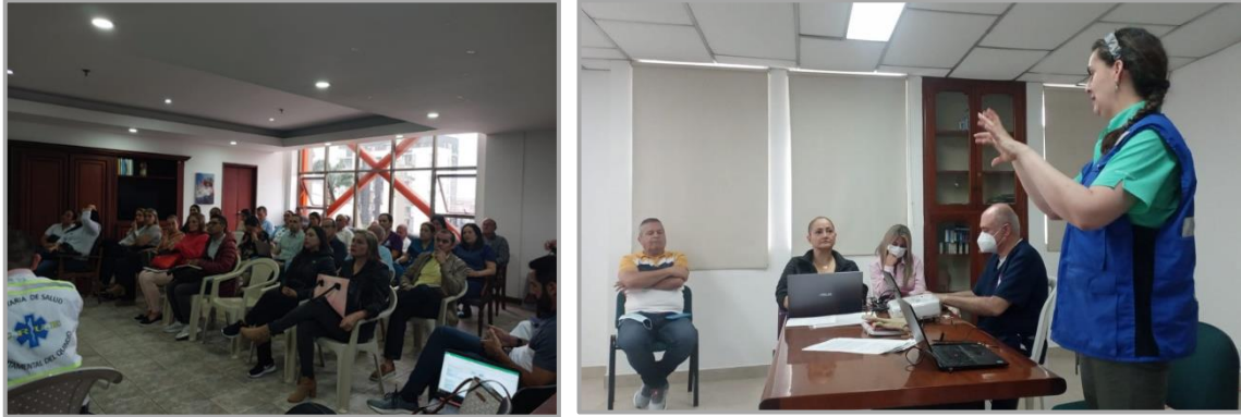
Ilustración 4. Imagen de la reunión entre OPS Colombia, la OGTE del MSPS y los CRUEs, alcaldes y gerentes de hospitales ubicados en zona de alto riesgo, departamentos de Caldas y Quindío