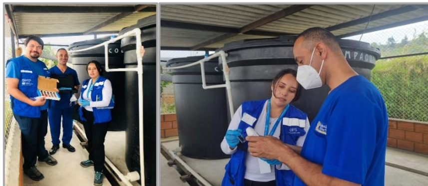
Ilustración 6. Imágenes del apoyo en el componente de Agua Saneamiento e Higiene (WASH) en las IPS de los municipios de ubicados en zona de alto riesgo, departamento de Caldas.