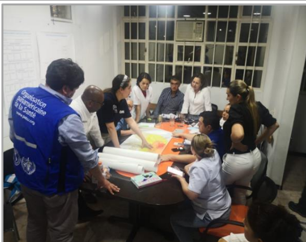
Ilustración 3. Imagen de la reunión con el director de la OGTED, OPS, gerentes de Hospitales de Caldas