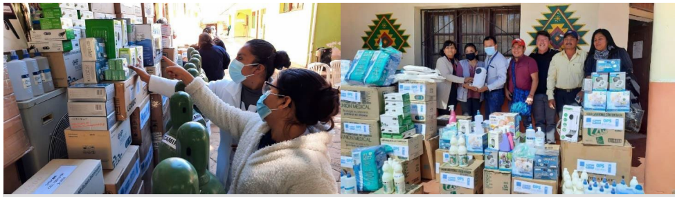
Figuras 7 y 8. Suministros entregados al hospital de Camiri y a las autoridades de Charagua.

En Bolivia , durante el período que abarca el informe, la OPS brindó apoyo técnico a la Dirección General de Medicina Tradicional y a representantes de los departamentos de medicina tradicional y del Sistema Único de Salud del Ministerio de Salud y Deportes. El objetivo de la colaboración es apoyar el uso de intervenciones de medicina tradicional en el Sistema Único de Salud, incluidos tratamientos alternativos para la COVID-19.