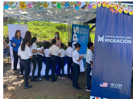
Figuras 1, 2 y 3. La OPS participa en actividades y eventos públicos para difundir información sobre la vacuna contra la COVID-19 en Costa Rica.

Además, en Costa Rica , la OPS y el Ministerio de Salud crearon videos para promover la vacunación contra la COVID-19 en las redes sociales. El UNICEF participa en la difusión de los videos. Los videos ya están siendo publicados en las redes sociales de la OPS y el Ministerio de Salud.