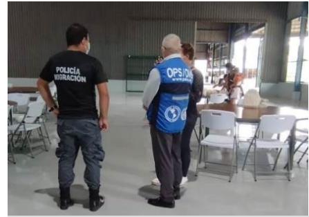
Figura 17. Un equipo de la OPS visita una instalación dedicada a asistir a poblaciones migrantes en Costa Rica.

En Costa Rica , la OPS visitó una estación de migrantes en Corredores, en la zona sur del país. El objetivo de las estaciones de migrantes es asistir a las personas migrantes o en tránsito por el país. La visita de la OPS tuvo como objetivo observar la atención brindada a las familias aisladas debido a la COVID-19 y otras afecciones de salud. La OPS donó material recreativo a niños y niñas en aislamiento, y brindó orientación al personal de limpieza sobre el manejo de residuos infecciosos.