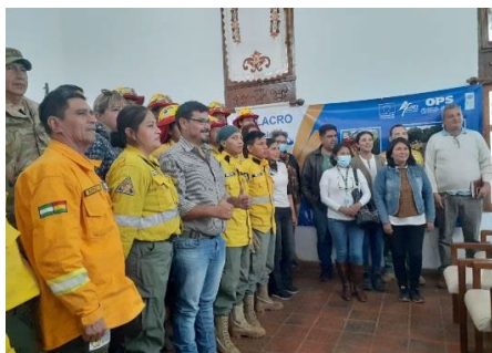
Figura 16. Equipo de evaluadores y observadores que participó en el ejercicio de simulación en Bolivia.

Junto con las autoridades de salud municipales, la OPS participó en la elaboración de protocolos médicos en apoyo del plan de contingencias municipal de San Ignacio Velasco, en Bolivia . El 19 de agosto del 2022, el plan fue validado tras un ejercicio de simulación realizado junto con las autoridades de salud y funcionarios de otros departamentos, como la Secretaría de Medio Ambiente, bomberos, militares, y otros. La OPS participó en el ejercicio, que puso a prueba la capacidad de respuesta institucional del municipio y la preparación del personal.