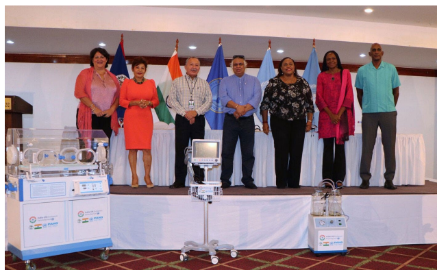
Figura 12. La OPS entrega una donación de equipo médico en Belice.

En Belice , la OPS, en colaboración con asociados y donantes internacionales, donó equipo médico para fortalecer la capacidad de los servicios de salud en el país. Entre el equipo médico donado había dos autoclaves para la gestión de desechos sanitarios, dos carros de transporte de desechos biomédicos, 20 monitores de pacientes, 10 camas de parto, 46 camas eléctricas para pacientes, 15 incubadoras, 7 máquinas de electrocardiograma, 12 camillas de transferencia con carros de emergencia y 10 máquinas de succión. Las donaciones forman parte de una iniciativa de colaboración multisectorial que tiene como objetivo fortalecer la capacidad de respuesta del sistema de salud a la COVID-19, mejorar la accesibilidad de los servicios locales de atención en apoyo de la recuperación tras la COVID-19, y concientizar sobre prevención, respuesta y recuperación de la COVID-19 a los grupos vulnerables urbanos y rurales en Belice.