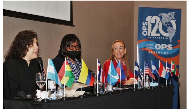
Figura 13. La Dra. Carissa Etienne, Directora de la OPS, y otras autoridades de salud participan en un evento de preparación ante pandemias en Argentina.

Del 16 al 19 de agosto del 2022, la OPS ofreció un taller regional sobre preparación y respuesta ante eventos con potencial pandémico y epidémico en Buenos Aires (Argentina). Con el objetivo de ayudar a los países de América Latina y el Caribe a elaborar o actualizar sus planes operativos para enfrentar futuras pandemias, el taller tuvo en cuenta las enseñanzas extraídas de la pandemia de COVID-19. Un plan de preparación y respuesta ante eventos con potencial epidémico y pandémico es una de las capacidades básicas requeridas por el RSI, una convención internacional jurídicamente vinculante adoptada por los Estados Miembros de la OMS para prevenir y responder a las amenazas de salud pública que pueden cruzar las fronteras y afectar a la población de todo el mundo. La OPS espera realizar talleres similares en otros países de la Región a lo largo del 2022. Los resultados de este y otros talleres integrarán la visión de la Región de las Américas en los documentos y directrices mundiales de preparación y respuesta ante pandemias.