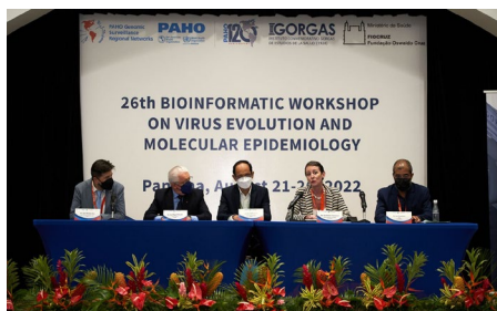
Figura 5: La OPS ofrece la 26.ª edición del Curso de Evolución Viral y Epidemiología Molecular (VEME, por su sigla en inglés), en

Del 21 al 26 de agosto del 2022, la OPS acogió a representantes de 17 laboratorios de salud pública de la Región de las Américas, que asistieron a la 26.ª edición del Curso de Evolución Viral y Epidemiología Molecular (VEME, por su sigla en inglés), en Panamá. La capacitación, organizada en colaboración con el Instituto Conmemorativo Gorgas de Estudios de Salud en Panamá y la Fundación Oswaldo Cruz (FIOCRUZ) en Brasil, tuvo por objetivo fortalecer la vigilancia genómica en la Región. Más de 120 personas de todo el mundo participaron en el evento, cuya primera edición se celebró hace más de 25 años en la Universidad de Lovaina, en Bélgica.