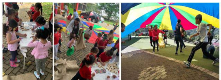
Figura 11. Niños y niñas en Costa Rica participan en actividades de promoción de la salud v educación.

En Costa Rica , del 3 al 9 de agosto del 2022, la OPS participó en un proyecto cuyo objetivo es habilitar un espacio donde los niños usen obras de arte para expresar lo que aprendieron de las actividades educativas sobre promoción de la salud y prevención de la COVID-19. Las actividades se llevaron a cabo en centros de cuidado y desarrollo infantil, y han beneficiado a aproximadamente 100 niños y niñas y sus familias.