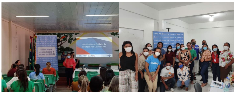
Figuras 9 y 10. Entrega de suministros al hospital de Camiri y a las autoridades de Charagua.

En Brasil , durante el período que abarca el informe, la OPS ofreció sesiones y actividades de fortalecimiento de la capacidad de atención de la salud, para concientizar a los trabajadores de la salud sobre las afecciones posteriores a la COVID-19 en la ciudad de Parintins, estado de Amazonas. Entre las actividades se encontraba la capacitación de 100 agentes comunitarios de salud. Como resultado de intervenciones previas en la región norte del país, la unidad de atención de afecciones posteriores a la COVID-19 de Santarém, estado de Pará, establecida con el apoyo de la OPS, ha registrado más de 560 visitas de enero a julio del 2022.