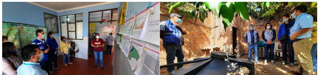
Figuras 14 y 15. Un equipo de la OPS visita la sala de situación y sistemas de agua que forman parte de las intervenciones del proyecto en la región del Chaco, en Bolivia.

En Bolivia , del 16 al 19 de agosto del 2022, la OPS y sus asociados internacionales llevaron a cabo una misión para dar seguimiento al progreso de un proyecto de la OPS en la región del Chaco. Algunos representantes de las organizaciones responsables de la ejecución del proyecto visitaron las oficinas de las autoridades locales, los centros de salud y las comunidades indígenas destinatarias. Al final, los expertos evaluaron el progreso de las actividades e hicieron recomendaciones para garantizar el logro de los objetivos del proyecto.