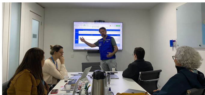
Figura 6. Reunión de cooperación técnica con la Secretaría Municipal de Salud de Río de Janeiro (Brasil).

En Brasil , durante el mes de agosto, se desplegó un equipo en el municipio de Río de Janeiro, en el estado de Río de Janeiro, para fortalecer la cooperación técnica entre la OPS y la Secretaría de Salud Municipal. El objetivo de la misión fue ampliar la capacidad local de vigilancia, preparación y respuesta a eventos de salud pública, emergencias de salud pública y desastres, con base en las enseñanzas extraídas de la pandemia de COVID-19.