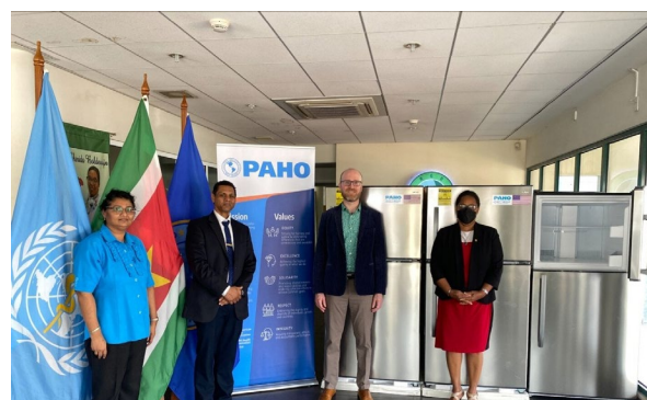
Figura 4. La OPS entrega 15 refrigeradores al Departamento Regional de Salud de Suriname.

En Suriname, el 8 de agosto del 2022, la OPS donó equipos al Departamento Regional de Salud como parte del esfuerzo por fortalecer el mantenimiento de la cadena de frío del país. La donación consistió en 15 refrigeradores que se utilizarán en 15 de los 55 establecimientos de salud del Departamento Regional de Salud para almacenar de forma segura las vacunas contra la COVID-19 y otras enfermedades. El equipo donado ayudará a mejorar la capacidad de Suriname para prevenir enfermedades, sobre todo en regiones fuera de la capital y en comunidades desatendidas.