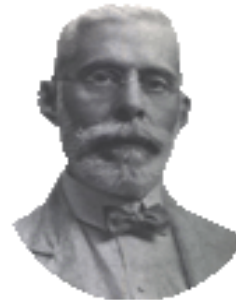
Dr. Juan Guiteras Gener

Secretaría de Sanidad y Beneficencia (1909) – primer Ministerio de Salud del mundo