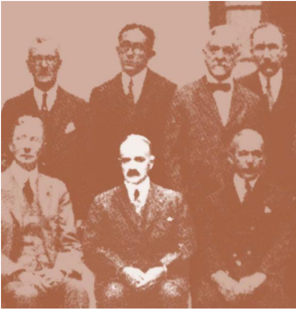
Dr. Carlos Manuel de Céspedes y Quesada. Secretario de Estado de la República de Cuba