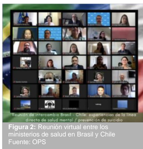
Figura 2: Reunión virtual entre los ministerios de salud en Brasil y Chile

La pandemia de COVID-19 ha causado estragos en la salud mental de la población de la Región. Reconociendo este reto, el 14 de abril la oficina de la OPS en Chile organizó una visita técnica entre los Ministerios de Salud de Brasil y Chile, para que Brasil pudiera aprender de la experiencia adquirida por Chile con la implementación de servicios de salud mental remotos, incluida la prevención del suicidio, durante la pandemia.