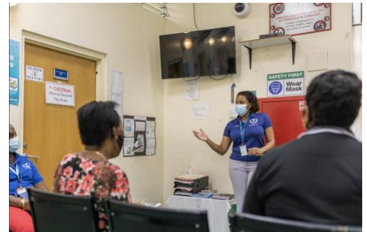
Figura 1: Un médico responde a preguntas críticas durante una charla sobre la vacunación en Trinidad y Tobago.

La rueda de prensa del 21 de abril se centró en el objetivo de abordar la desinformación que está impulsando la reticencia a la vacunación . La doctora Etienne advirtió que “cada persona de un grupo de población vulnerable que duda sobre si recibir la vacuna podría pasar a formar parte de la otra cara de las estadísticas, la de los miles de muertes diarias debidas a la COVID-19. Las vacunas están salvando vidas y contribuirán a controlar la transmisión en un futuro cercano, cuando logremos una alta cobertura de inmunización.” Los informes de efectos secundarios muy poco comunes e inesperados de las vacunas contra la COVID-19 no deberían hacer que la gente se vuelva renuente a vacunarse, ya que a la hora de prevenir infecciones, hospitalizaciones y muertes los beneficios de estas vacunas evaluadas por la OMS superan los riesgos de los efectos secundarios. Las vacunas contra la COVID-19 ya están ayudando a reducir el número de infecciones. Los datos de Chile, Brasil e Israel indican una reducción del número de hospitalizaciones de personas mayores, en parte debido a las vacunas contra la COVID.