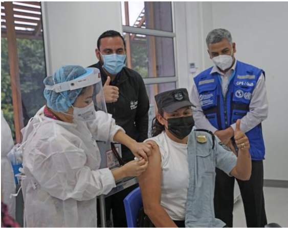
Figura 3: La segunda ronda de vacunas del Mecanismo COVAX llega a Ecuador.

El apoyo de la OPS se extiende a aquellos países interesados en obtener acceso a las vacunas experimentales a través del Mecanismo COVAX . El Fondo Rotatorio de la OPS , con cuatro décadas de experiencia en la obtención y distribución de vacunas, desempeñará una función clave en este proceso, apoyando a los países a lo largo del camino. Gracias al Fondo Rotatorio, 41 países y territorios de la Región han podido aunar recursos para adquirir vacunas de alta calidad, jeringas y otros suministros necesarios para su población, a un precio menor que el que obtendrían por separado. Este apoyo se ve complementado por los esfuerzos de la OPS para predecir la demanda de vacunas contra la COVID-19 por parte de los países que participan en el Fondo Rotatorio.