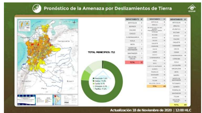
Figura 2. IDEAM