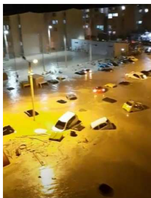
Figura 4. RCN