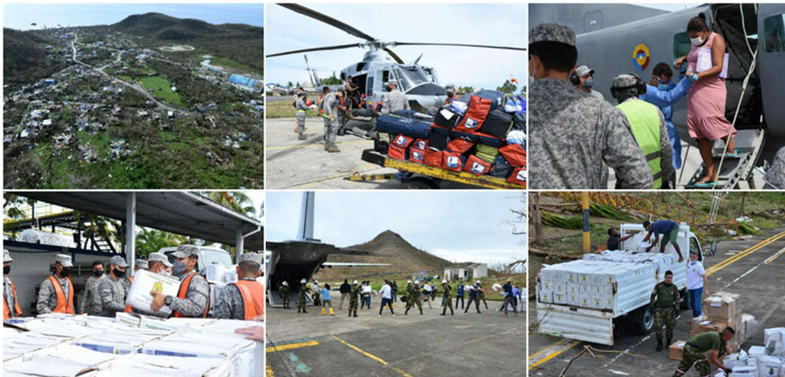
Figura 3. UNGRD