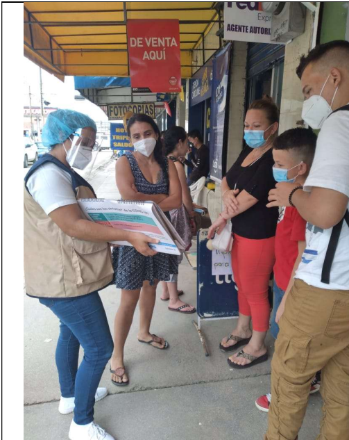
Imagen 4. Colaboradores del Proyecto Salvando vidas en tiempos de COVID-19, enfatizando medidas de protección y prevención de la COVID-19.