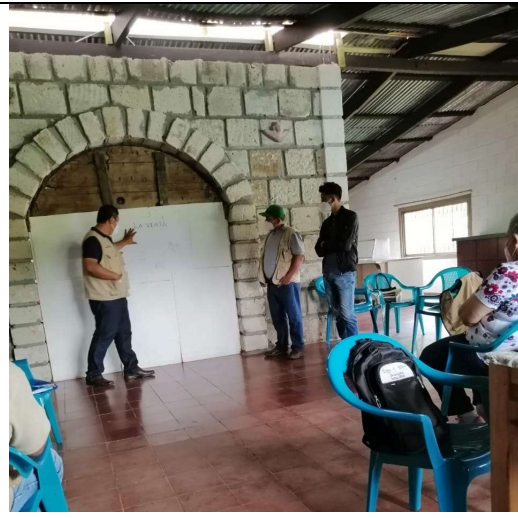
Imagen 3. Gracias al apoyo financiero por parte de OPS/OMS en Honduras, la Región Sanitaria de Francisco Morazán pudo realizar la capacitación sobre la Guía Técnica para el funcionamiento de los equipos de salud familiar.