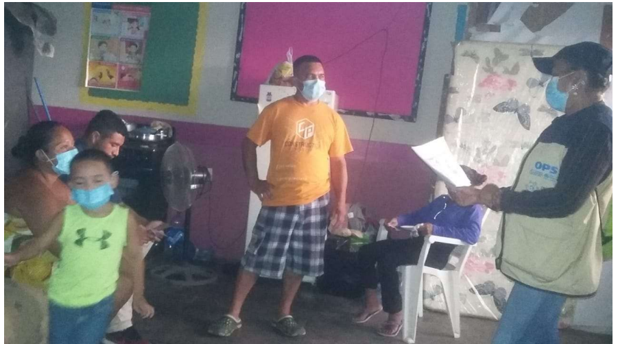
Imagen 5. Colaboradores del Proyecto Salvando vidas en tiempos de COVID-19 en albergues, enfatizando medidas de protección y prevención de la COVID-19.