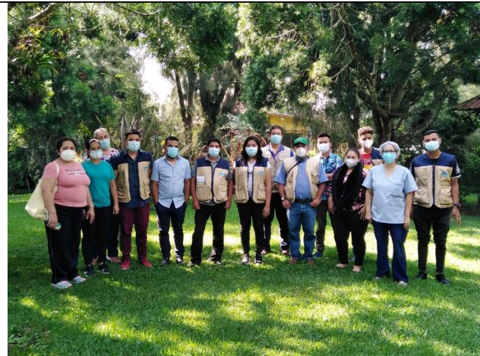
Imagen 2. Técnicos y Auxiliares en Salud Ambiental y personal técnico de los establecimientos de salud, capacitados para operativizar las 10 etapas de las actividades de los equipos de salud familiar en el marco del Modelo Nacional de Salud.