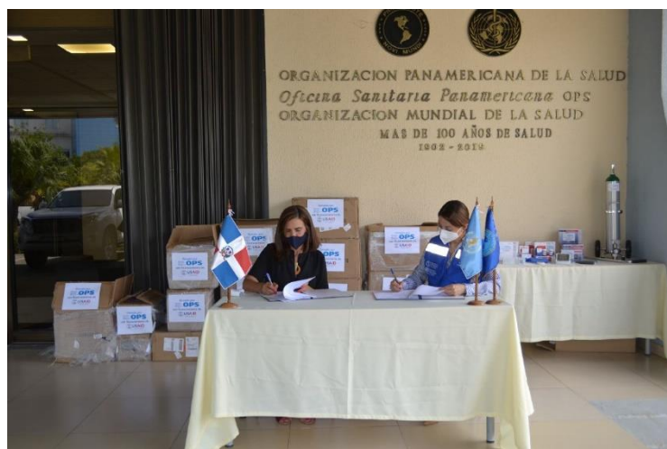
Representante de OPS junto a la directora de Primer Nivel del SNS durante la entrega.