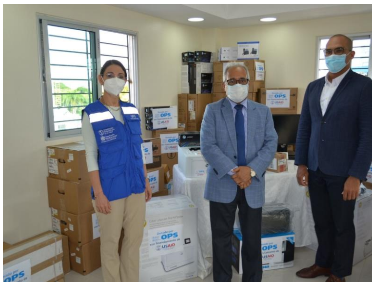
Representante de OPS junto al ministro de salud y al viceministro de salud colectiva.