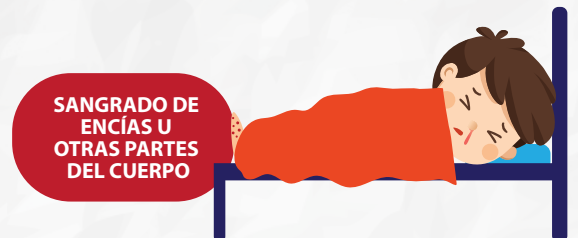
SANGRADO DE ENCÍAS U OTRAS PARTES DEL CUERPO