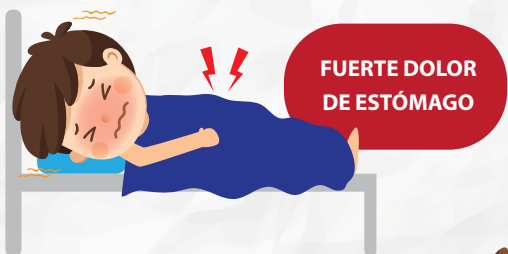
FUERTE DOLOR DE ESTÓMAGO