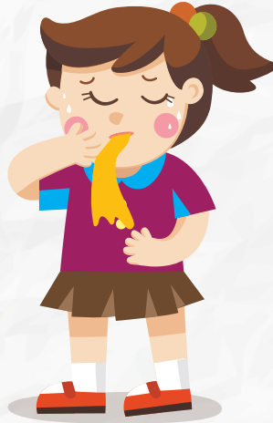
NÁUSEAS O VÓMITOS