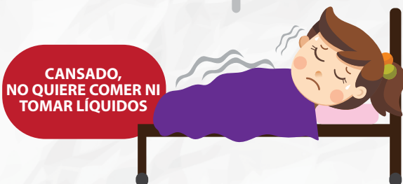
CANSADO, NO QUIERE COMER NI TOMAR LÍQUIDOS