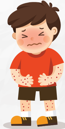
SARPULLIDO (PUNTITOS ROJOS)