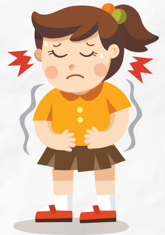
DOLOR DE CABEZA Y/O DEL CUERPO

SI SE AGRAVA Y PRESENTA ALGUNO DE LOS SIGUIENTES SÍNTOMAS, TU HIJA, HIJO U OTRO MIEMBRO DE LA FAMILIA PUEDE MORIR, LLÉVALO DE INMEDIATO AL HOSPITAL MÁS CERCANO