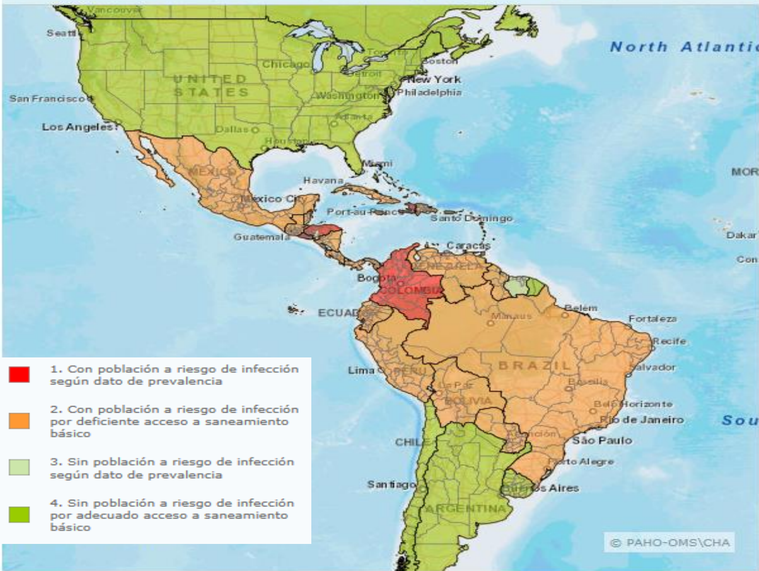
Áreas con población a riesgo de infección por Geohelmintiasis (en 2014)

26 países en las Américas con población a riesgo