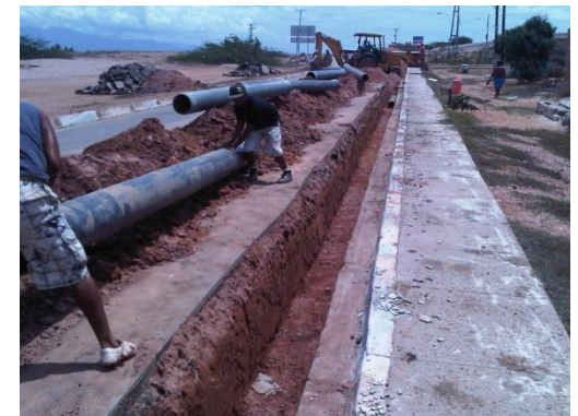
Mesas Técnicas de Agua