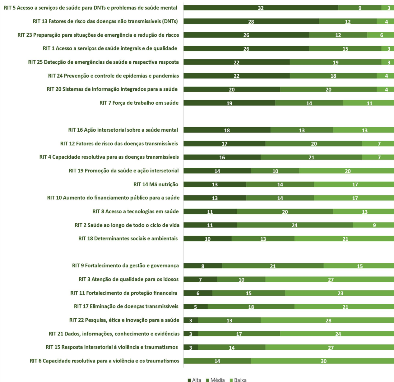
Figura 1. Resultados agregados dos exercícios de priorização para o Orçamento por Programas 2024–2025 (Número de países e territórios por classificação de prioridade para cada resultado intermediário)

Observação: Os resultados 26, 27 e 28 foram excluídos devido a seu caráter meramente institucional.