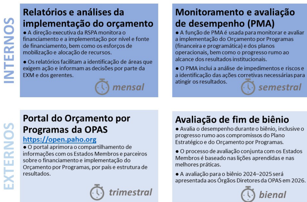
Figura 3. Visão geral dos mecanismos de monitoramento e avaliação do Orçamento por Programas 2024– 2025

79. No âmbito dos países, a RSPA continuará a melhorar a prestação de contas dos resultados por meio dos mecanismos mencionados acima, além de aproveitar inovações que impulsionam o impacto da Organização nos países. A RSPA também continuará atualizando, monitorando e avaliando regularmente as estratégias de cooperação com os países da OPAS/OMS.