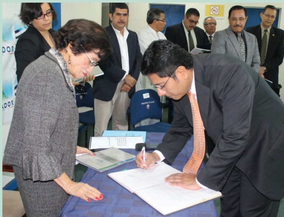
Les membres du CAPI sont assermentés par la ministre.

Ces réalisations illustrent comment le Programme de vaccination national salvadorien prend des mesures visant à renforcer le programme actuel et à en assurer la pérennité pour l'avenir. ■