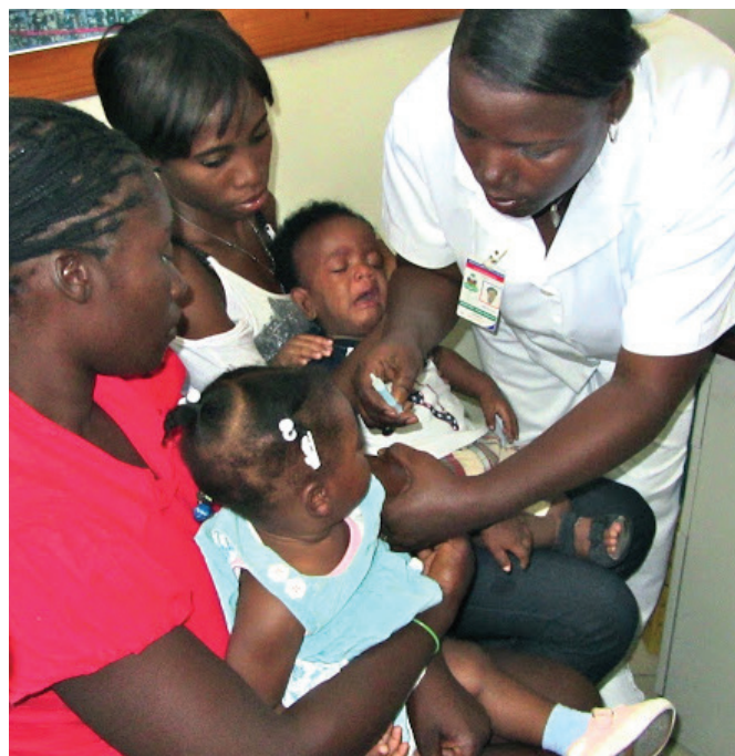
Un enfant est vacciné durant les activités intensives pour la santé de l'enfant en Haïti.

Ces activités de vaccination intensives, qui ont commencé en avril 2012, ont contribué de manière importante au programme de vaccination d'Haïti, en constituant les premières étapes du renforcement des activités de vaccination systématique.