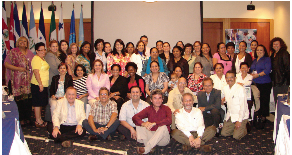
Participants à l'atelier international sur les opérations de la chaîne du froid au Nicaragua, juillet 2012.

Par la suite, on a réparti les participants en cinq groupes de travail. Chaque groupe a examiné chaque unité du module, a discuté des enjeux présentés et a fourni des suggestions en vue d'homologuer chacune d'elles, y compris des recommandations quant à la façon d'améliorer les informations présentées. De plus, on a tenu une séance de questions et réponses avec le panel après l'exa-