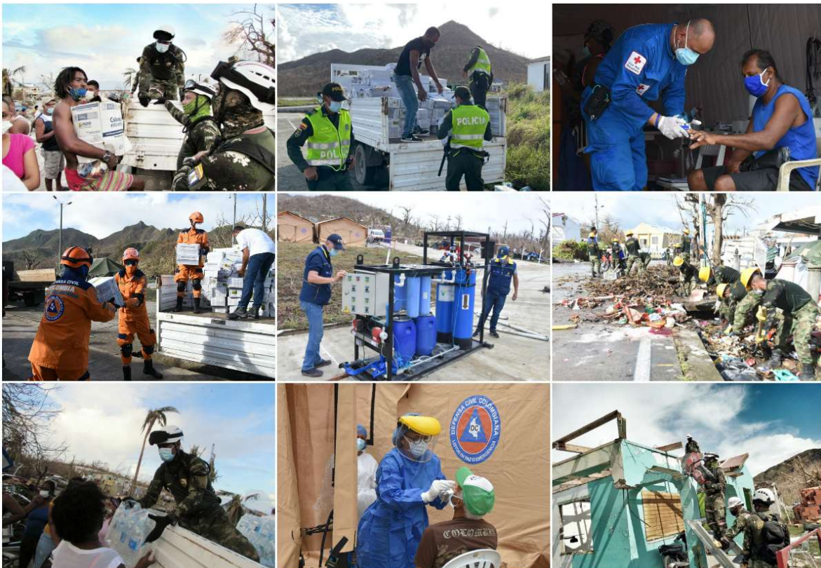
Imagen 3. Respuesta Humanitaria San Andrés UNGRD