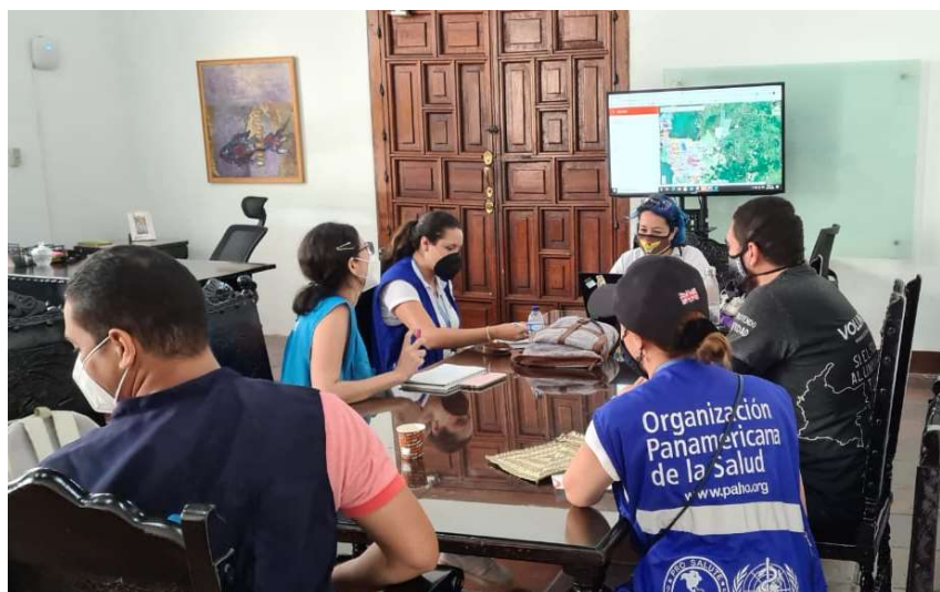
Imagen 5: PMU Cartagena