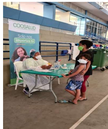
Figura 2. Instalación de albergues en Cartagena.