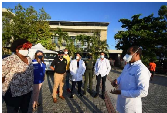
Figura 2. Apoyo OPS/OMS en Cartagena