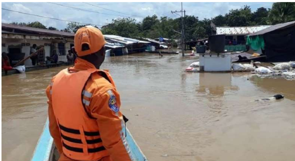
Figura 3. Fuente El Tiempo.

Se reportan inundaciones en las cuencas de los ríos Condoto, Tamana, Cajón y Sipí. Se destacan las afectaciones en el municipio de Condoto, así como posibles desbordamientos en Andagoya.