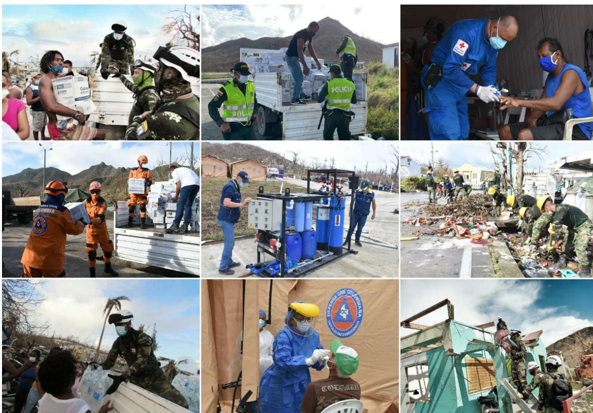
Imagen 3. Respuesta Humanitaria San Andrés UNGRD