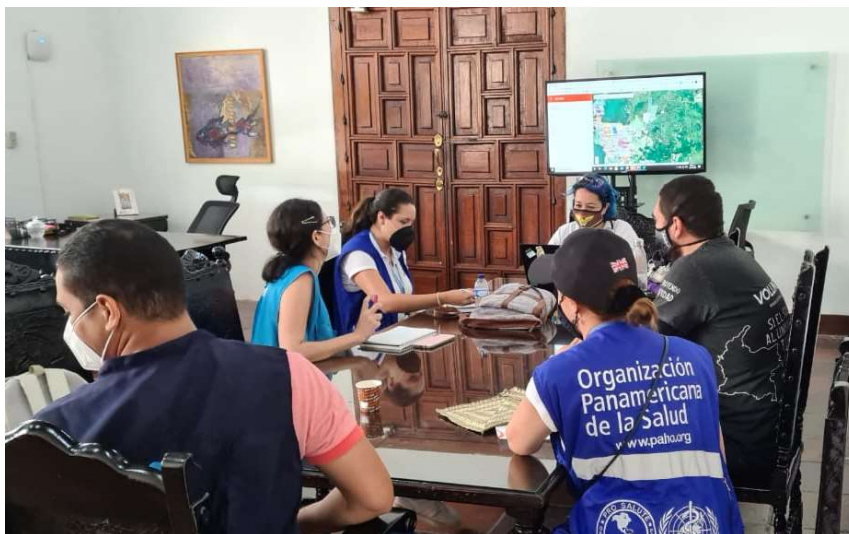
Imagen 5: PMU Cartagena