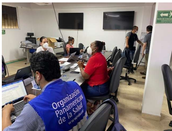
Imagen 4: Sala Situacional San Andrés donada por el INS con fondos USAID