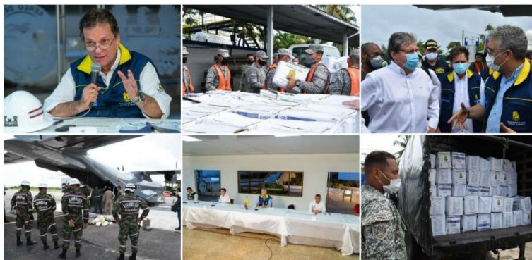
Figura 4. UNGRD