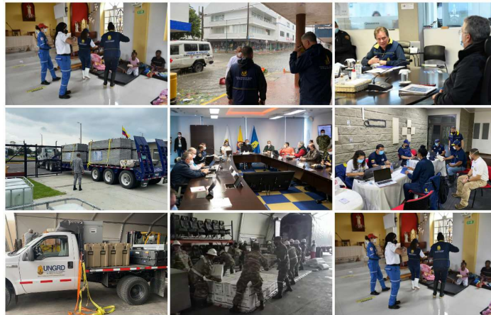
Figura 3. UNGRD

Las acciones desarrolladas hasta el momento en la isla de Providencia incluyen: