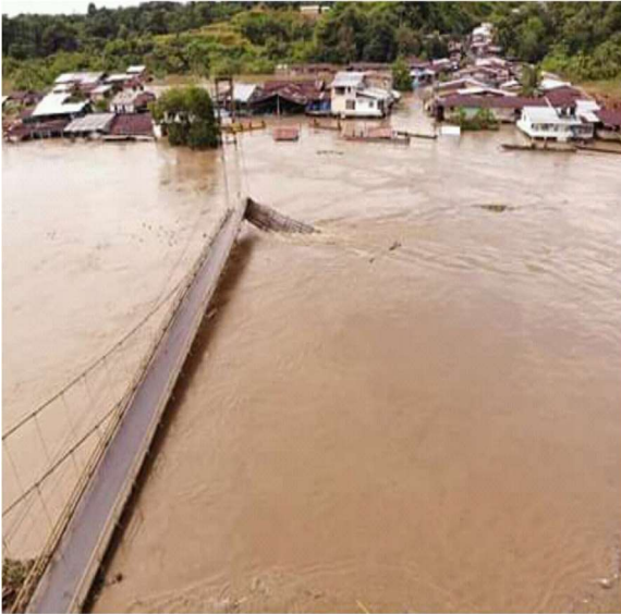
Imágenes Municipio Lloró

Chocó 10 municipios (Lloró, Carmen de Atrato, Bagadó, Tadó, Condoto, Medio San Juan, Atrato, Nóvita, Bojayá y Medio Atrato), reportaron impacto en al menos 1.824 familias (7.000) por deslizamientos e inundaciones ocasionadas por el desbordamiento de los ríos Andágueda, Atrato, San Juan y Bebaramá.