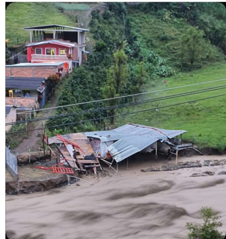
Imágenes Municipio Lloró