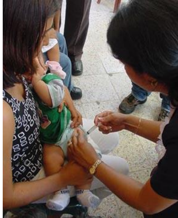
Un bebé es vacunado durante el lanzamiento de la Semana de Vacunación en El Salvador.