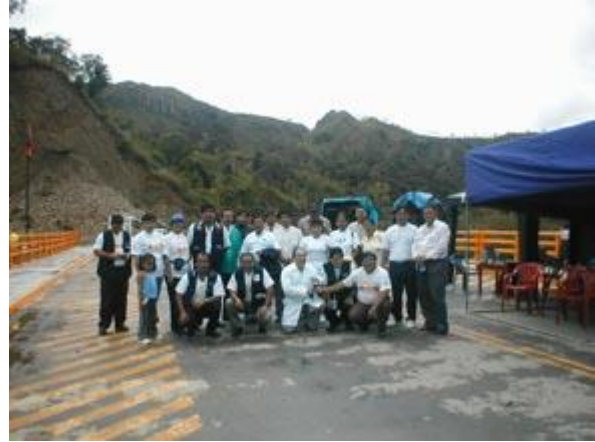
Trabajadores de salud se reúnen para cruzar a Jaen, Perú, en la frontera entre Perú y Ecuador.

El lanzamiento de la semana de vacunación fue una oportunidad para demostrar la grandeza de las acciones de salud, como puente para la solidaridad entre los pueblos, para el entendimiento, para abrir caminos y esperanzas de un futuro mejor.