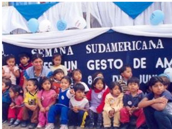
Niños del lado peruano de la frontera entre Perú y Ecuador se colocaron calcomanías especiales luego de recibir sus vacunas.

Esta vez participaron 19 países de Sudamérica, Centroamérica y el Caribe con la meta de vacunar especialmente a aquellos niños que nunca habían sido inmunizados o que necesitaban completar sus esquemas de vacunas. El principal objetivo fue consolidar la interrupción de la transmisión del sarampión (no se registra circulación en la región desde hace más de seis meses) así como también mantener la erradicación de la polio y proteger a los niños de aquellas enfermedades prevenibles por vacunación.