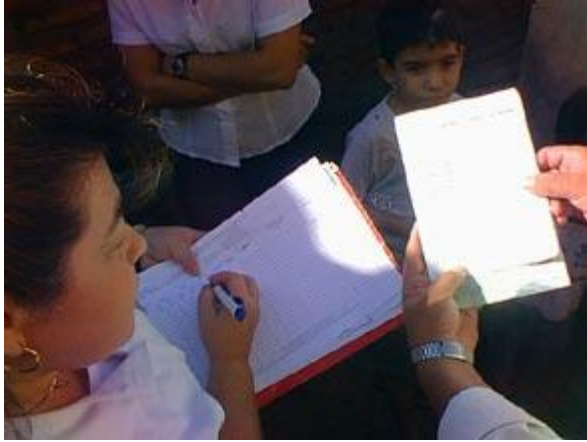
Trabajadores de Salud en Asunción, Paraguay, comparan datos sobre los vecindarios que históricamente han tenido baja cobertura de vacunación.