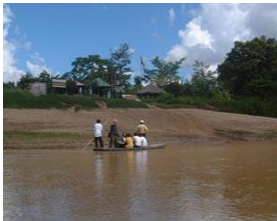
Trabajadores de salud viajan en bote para vacunar a niños en ciudades y pueblos remotos, en la zona de frontera entre Bolivia, Perú y Brasil.

En las ciudades de Bolpebra, Iñaparí y Asís, en la frontera entre Bolivia, Perú y Brasil, agentes de salud y pobladores soportaron más de 46 grados Celsius para el lanzamiento de la semana, despidiendo a trabajadores de salud que partieron en balsas hacia poblaciones a las que sólo se puede llegar por río. Entre los dignatarios que participaron estuvieron el ministro de Salud de Bolivia, Javier Torres Goitía; el viceministro de Salud de Perú, Carlos Rodríguez, y representantes del Ministerio de Salud de Brasil.