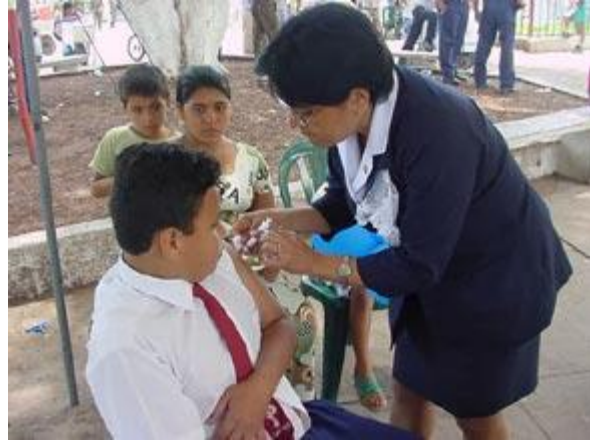
Una trabajadora de salud vacuna a un niño en edad escolar. La iniciativa regional realizó esfuerzos especiales para llegar a aquellos niños que nunca habían sido vacunados o que no habían completado el esquema de vacunas.