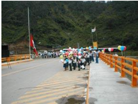
Escolares desfilan para celebrar la Semana de Vacunación en las Américas, en el cruce fronterizo entre Ecuador y Perú.

Mujeres, niños y niñas, jóvenes, adultos, todos recibieron a las comitivas que llegaban desde puntos alejados de los tres países con abrazos, sonrisas y con una manifestación de profundo deseo de sobrevivir y mejorar sus condiciones de vida y su situación de salud. Puestos de vacunación por doquier, pequeños en brazos de sus padres; jóvenes mujeres en edad reproductiva, todos tomaron a decisión de vacunarse, de prevenir enfermedades.