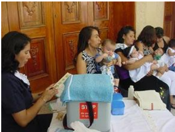
Madres esperan para vacunar a sus niños en San Martín, San Salvador.