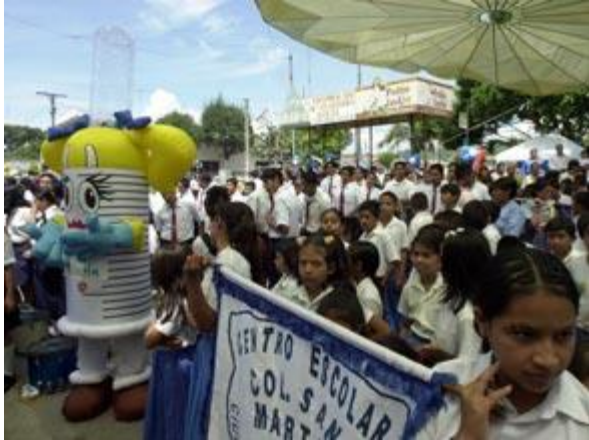
Niños se reúnen en San Martín, en el departamento de San Salvador, El Salvador, para el lanzamiento de la Semana de Vacunación de las Américas.