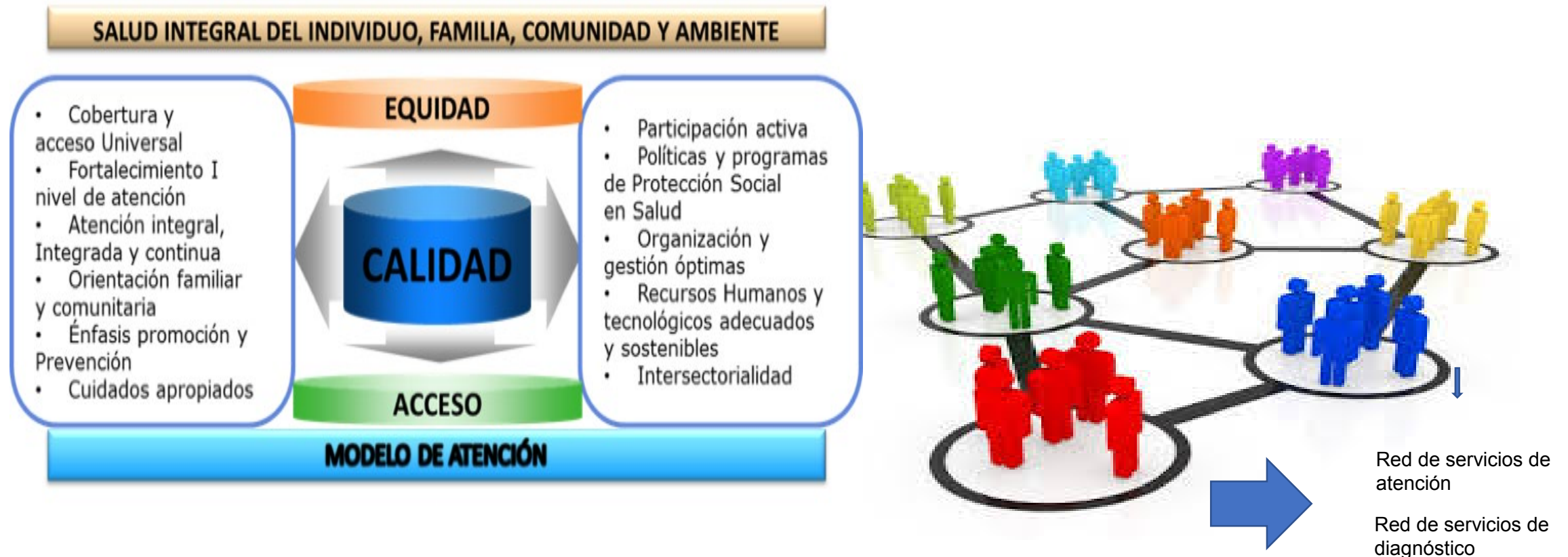
Figura No. 2