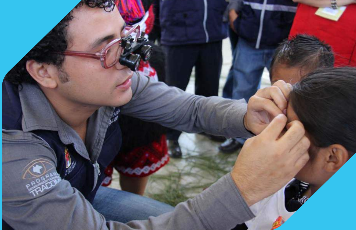
Brigadistas hacen examen ocular a niños de Chiapas, México en busca de tracoma ocular.

El Gobierno de Chiapas especifica que en 2010 se destinaron más de 470 millones de dólares estadounidenses a los programas de Agua Potable, Alcantarillado y Saneamiento en Zonas Urbanas y al convenio para la Construcción y Rehabilitación de Sistemas de Agua Potable y Saneamiento en Zonas Rurales.