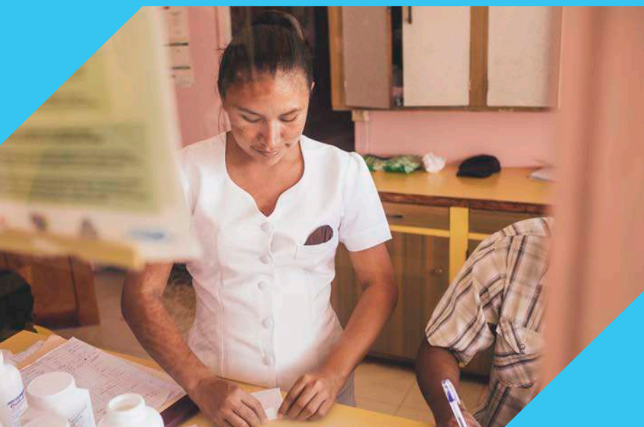
Trabajadores de la salud proveen medicamentos para la malaria.

La historia de éxito en las Américas, como modelo para otras regiones del mundo, se completa con el ejemplo de Argentina, que en 2014 solicitó oficialmente a la OMS iniciar el proceso de certificación de la eliminación del paludismo en todo su territorio nacional.