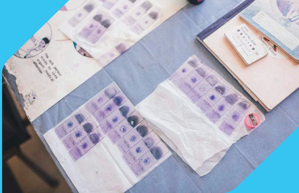
Pruebas de diagnóstico de malaria.

se otorgó el premio "Campeones contra el Paludismo en las Américas" a los proyectos de la República Dominicana, Honduras y Guatemala por sus logros en la prevención y el control de la malaria y el avance hacia su eliminación. Los proyectos son ejemplos de esfuerzos que contribuyeron a reducir extraordinariamente la carga de la malaria en las Américas en los últimos años. "Hemos dado un paso grandísimo, hemos visto reducir el número de casos drásticamente desde el último año" comentó un oficial del Centro Nacional de Control de las Enfermedades Tropicales (CENCET) de República Dominicana. "Me siento feliz, porque los