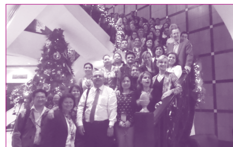
Participantes en la Reunión Regional de Vigilancia Centinela de las Neumonías y Meningitis Bacterianas, Panamá, diciembre del 2014.

El tema central de la reunión fue analizar con epidemiólogos y profesionales de laboratorio de qué manera se puede mejorar la calidad de los datos generados por los centros centinela. Se recalcaron los indicadores que deben alcanzar los países para poder formar parte de la Red Mundial de Vigilancia. El reto