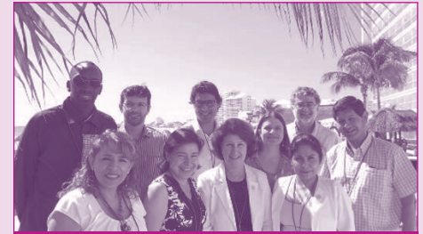
Asistentes a la reunión regional de la Red de Laboratorios Antipoliomielíticos en Cancún (México), en noviembre del 2014.

(incluyendo los poliovirus derivados de la vacuna). Por último, en una sesión de lluvia de ideas, se trataron los temas de la detección, la caracterización y la epidemiología molecular de los poliovirus salvajes, los poliovirus derivados de la vacuna y los poliovirus Sabin, así como la vigilancia ambiental de poliovirus. Igualmente, se presentaron recomendaciones sobre la carga de trabajo de rutina, las líneas celulares, los poliovirus derivados de la vacuna, las pruebas de competencia, la vigilancia ambiental, los sistemas de información y las capacitaciones y reuniones futuras. ■