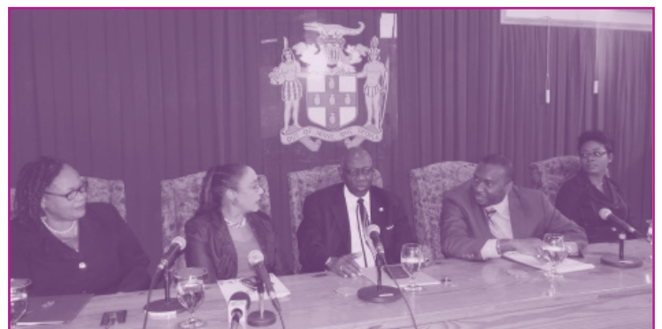
El Ministro de Salud, Doctor Fenton Ferguson (en el centro), hace un planteamiento durante la inauguración de la Campaña de Prevención del Sarampión del Ministerio de Salud jamaicano celebrada en la Oficina del Primer Ministro, el lunes 16 de febrero del 2015.

la administración de la vacuna SRP, incluida la dosis de refuerzo, también se suministrarán otras vacunas disponibles en el sector público que los niños tal vez no hayan recibido." El Ministro agregó: "los principales objetivos son reconocer a los niños que no han recibido una vacunación completa para su edad, con el fin de mejorar la cobertura general de vacunación en Jamaica y, lo que es más importante, ofrecer una protección adecuada con el propósito de disminuir la población de niños vulnerables al sarampión y al mismo tiempo actuar sobre otras enfermedades prevenibles por vacunación como la rubéola."