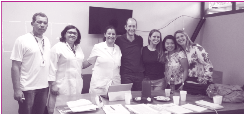
Capacitación sobre el terreno en materia de colección de datos, realizada en Brasilia (Brasil) en septiembre del 2014.

La Iniciativa ProVac de la Organización Panamericana de la Salud (OPS) está colaborando estrechamente en un estudio con la Universidad Federal de Goiás para determinar los costos del Programa Nacional de Inmunización de Brasil (PNI), con el apoyo financiero del ministerio de salud brasileño. El PNI de Brasil celebró recientemente su 40º aniversario. Fue pionero en la introducción de nuevas vacunas y tiene uno de los esquemas de vacunación más completos de la Región. Sin embargo, se desconocen los costos totales del programa.