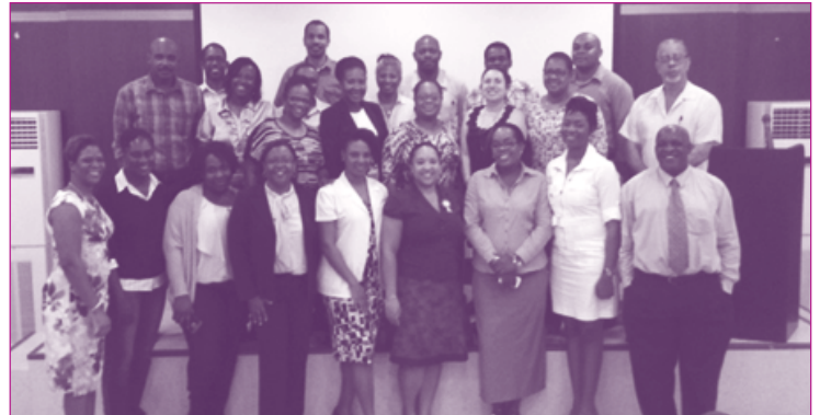
Participantes en el taller sobre la vigilancia de las enfermedades prevenibles por vacunación realizado en Santa Lucía, en febrero del 2015.

El programa del taller incluyó un resumen del Programa Ampliado de Inmunización (PAI) en Santa Lucía y actualizaciones técnicas sobre las enfermedades prevenibles por vacunación, el sistema de vigilancia y los indicadores para presentar sobre el sarampión, la rubéola, el síndrome de rubéola congénita y la poliomielitis. Las presentaciones estuvieron a cargo del gerente del PAI y el epidemiólogo nacional de Santa Lucía y de asesores del PAI de la Organización Panamericana de la Salud (OPS). Participaron en el taller 23 personas, entre ellas doce médicos y gerentes del PAI invitados de Barbados y Jamaica.