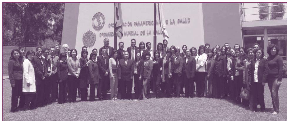
Participantes en la evaluación de la estrategia nacional de inmunización del Perú en Lima, en octubre del 2014.