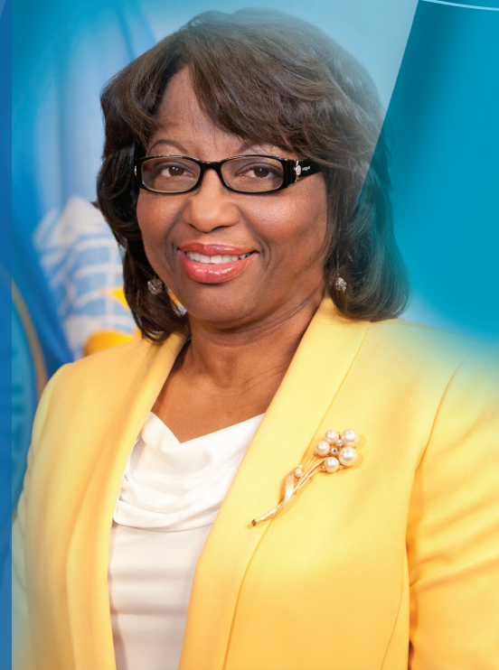
Dra. Carissa F. Etienne Directora de la OPS

En total hubo 31 consultas en igual número de países con la participación de aproximadamente 1.300 personas. El proceso de consulta permitió reunir un conjunto de contribuciones que enriquecen el documento de estrategia y evidencian las necesidades de los países.