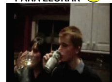
Tragedia en fiesta de adolescentes