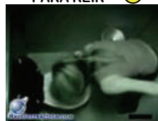
Chica borracha cae en el toilet