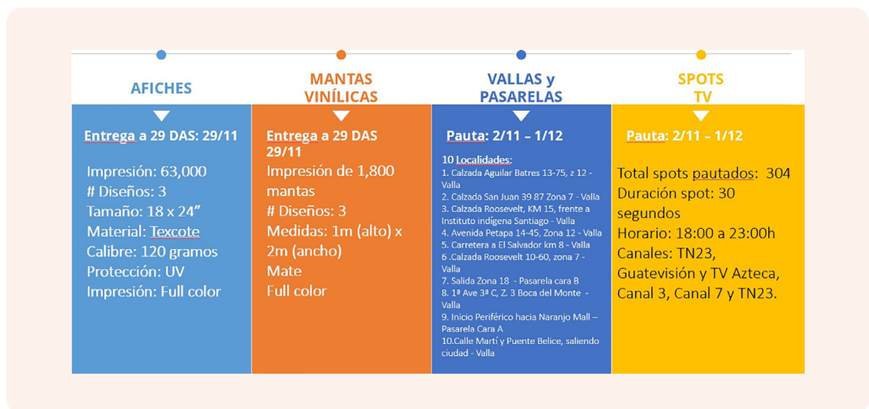
Figura 1. Campaña de comunicación del plan nacional de vacunación contra COVID-19

Esta contribución complementa el ofrecimiento de apoyo por parte de organizaciones que participan en el subgrupo de comunicación de riesgos, quienes ofrecieron sus canales de comunicación para difundir los materiales de la campaña. La Figura 1 resume la implementación de las fases de la campaña de comunicación del plan de vacunación nacional contra COVID-19, con acciones de la Fase 1, incluyendo distribución de afiches e instalación de mantas vinílicas y vallas publicitarias, movilizadas al 31 de octubre de 2021.