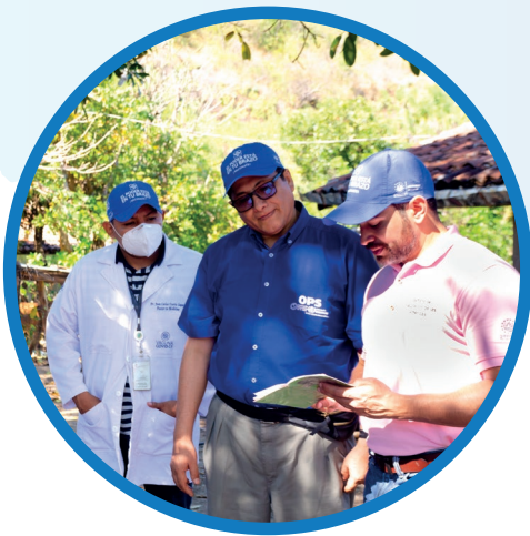
Autoridades de Salud se preparan para jornada de vacunación.

Liderar esfuerzos colaborativos estratégicos entre los Estados Miembros y otros aliados, para promover la equidad en salud, combatir la enfermedad, y mejorar la calidad y prolongar la duración de la vida de la población de las Américas.