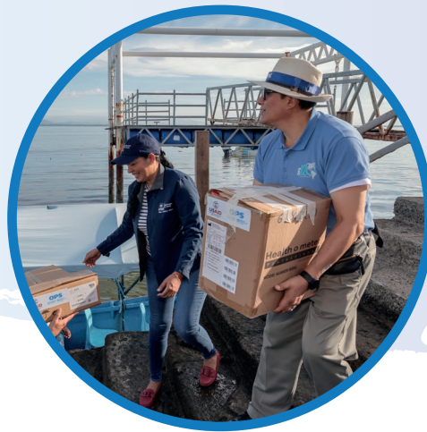
Equipo del Ministerio de Salud y la OPS embarcan donativo para Isla Conchagüita, La Unión.

Ser el mayor catalizador para asegurar que toda la población de las Américas goce de una óptima salud y contribuir al bienestar de sus familias y sus comunidades.