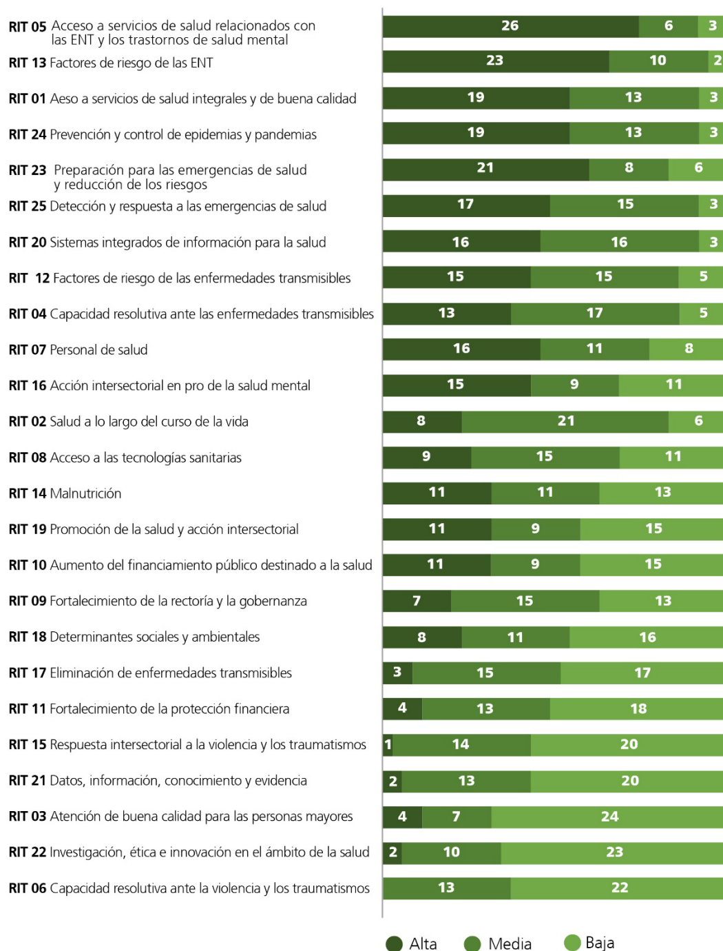
Figura 1. Resultados consolidados de la asignación de prioridades para el Presupuesto por Programas 2024-2025 Número de países y territorios por nivel de prioridad de cada resultado intermedio (resultados preliminares al 12 de enero del 2023)

Nota: Los ocho resultados intermedios en la parte superior de la figura son los que se consideran actualmente como de prioridad alta según los resultados preliminares. Se excluyeron los resultados 26, 27, y 28 debido a la naturaleza institucional de su alcance.