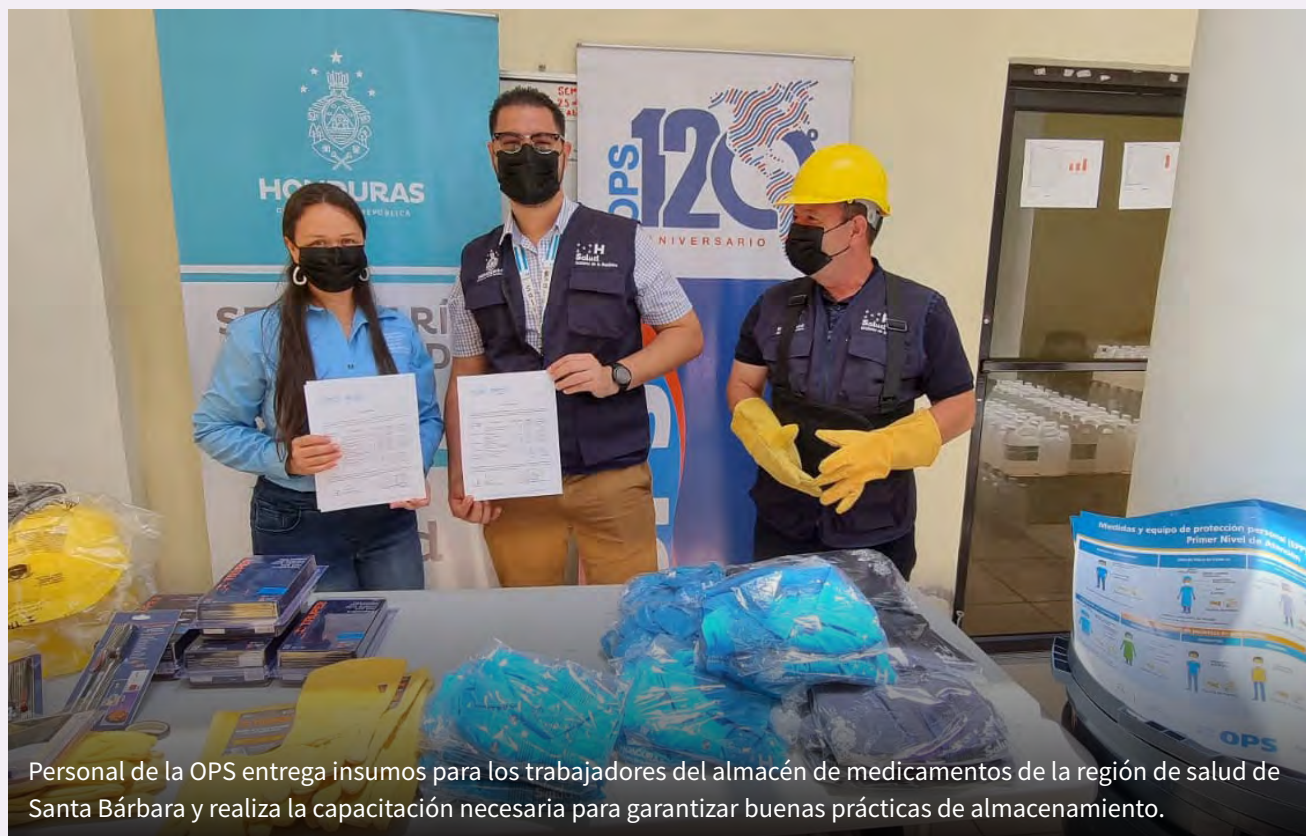
Personal de la OPS entrega insumos para los trabajadores del almacén de medicamentos de la región de salud de Santa Bárbara y realiza la capacitación necesaria para garantizar buenas prácticas de almacenamiento.

doméstica desde las consejerías de familia, capacitando al personal de salud para la detección y atención a las sobrevivientes de violencia mediante cursos que, durante la pandemia, han migrado a una plataforma virtual. Junto al abordaje de la seguridad humana y la salud, se dedican también esfuerzos a trabajar la prevención de la violencia que afecta a jóvenes en situación de riesgo social.