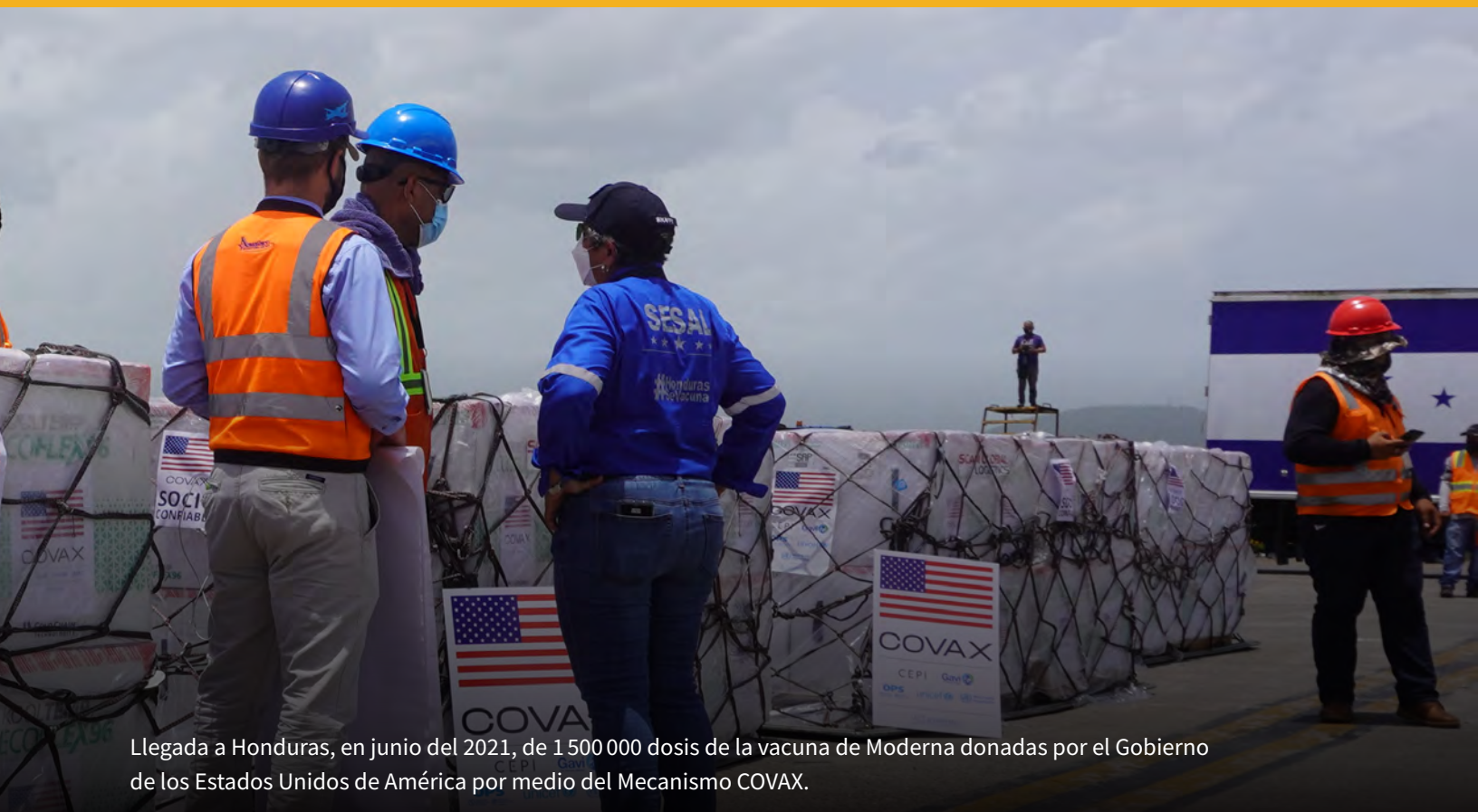
Llegada a Honduras, en junio del 2021, de 1 500 000 dosis de la vacuna de Moderna donadas por el Gobierno de los Estados Unidos de América por medio del Mecanismo COVAX.

La lucha contra la pandemia de COVID-19 y la rehabilitación de establecimientos dañados por las tormentas Eta e Iota fueron algunas de las prioridades de la OPS y las autoridades hondureñas en el 2021.