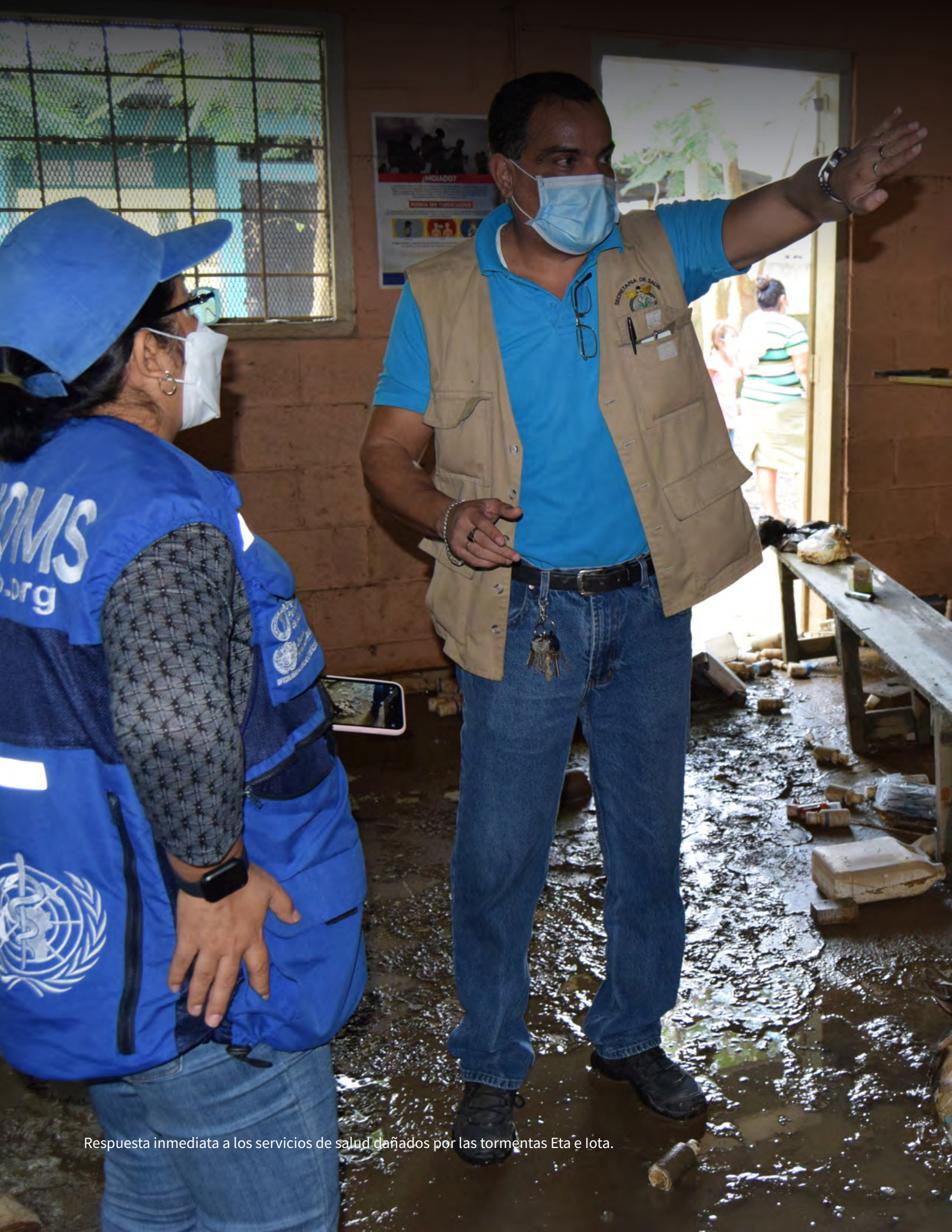
Respuesta inmediata a los servicios de salud dañados por las tormentas Eta e Iota.