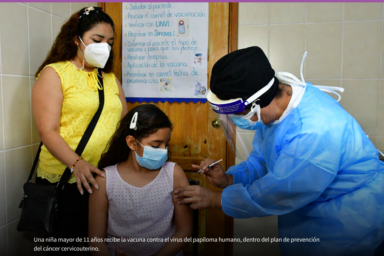
Una niña mayor de 11 años recibe la vacuna contra el virus del papiloma humano, dentro del plan de prevención del cáncer cervicouterino.

La lucha contra el cáncer y la mejora de la salud mental fueron dos áreas para cuyo avance la OPS brindó apoyo a las autoridades hondureñas.