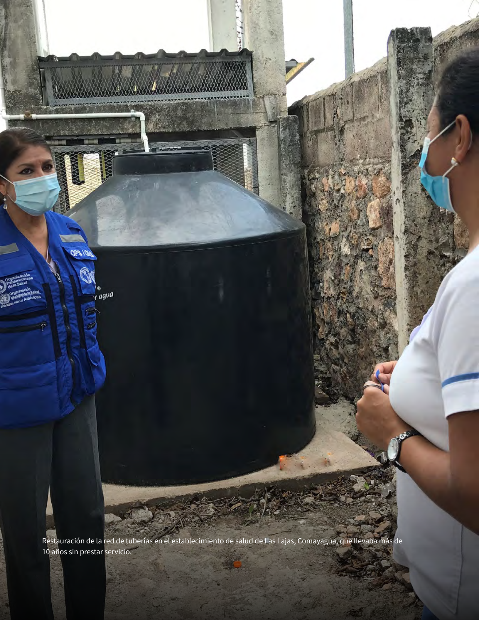
Restauración de la red de tuberías en el establecimiento de salud de Las Lajas, Comayagua, que llevaba más de 10 años sin prestar servicio.