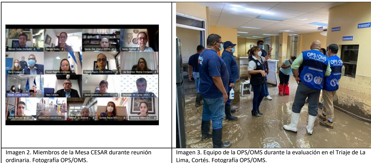
Imagen 2. Miembros de la Mesa CESAR durante reunión ordinaria.