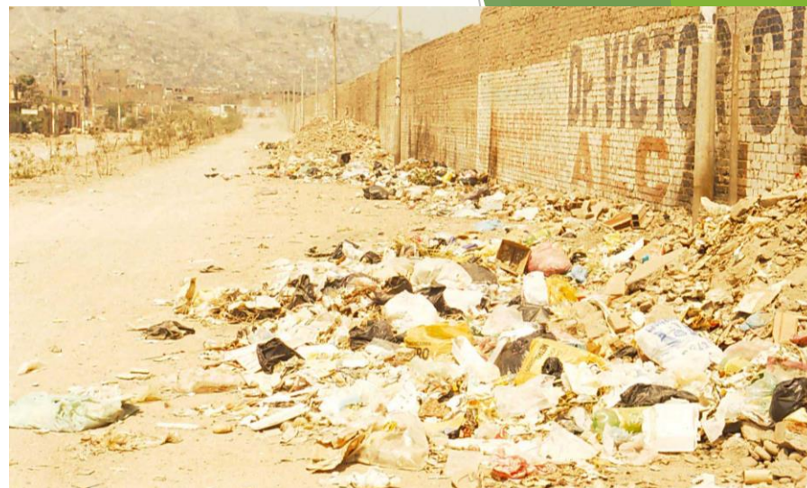
AV. PLACIDO JIMENEZ