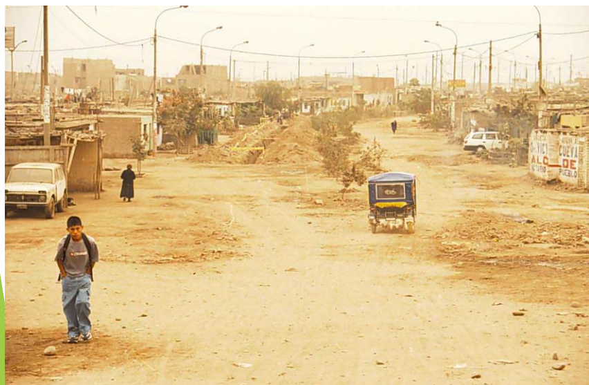
AV. RIVA AGUERO