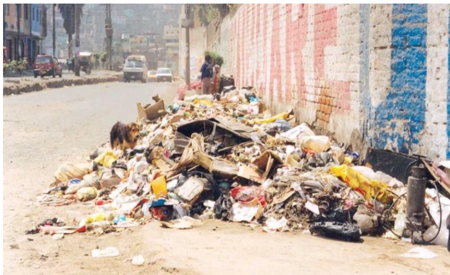
INGRESO A LA AV. RIVA AGUERO