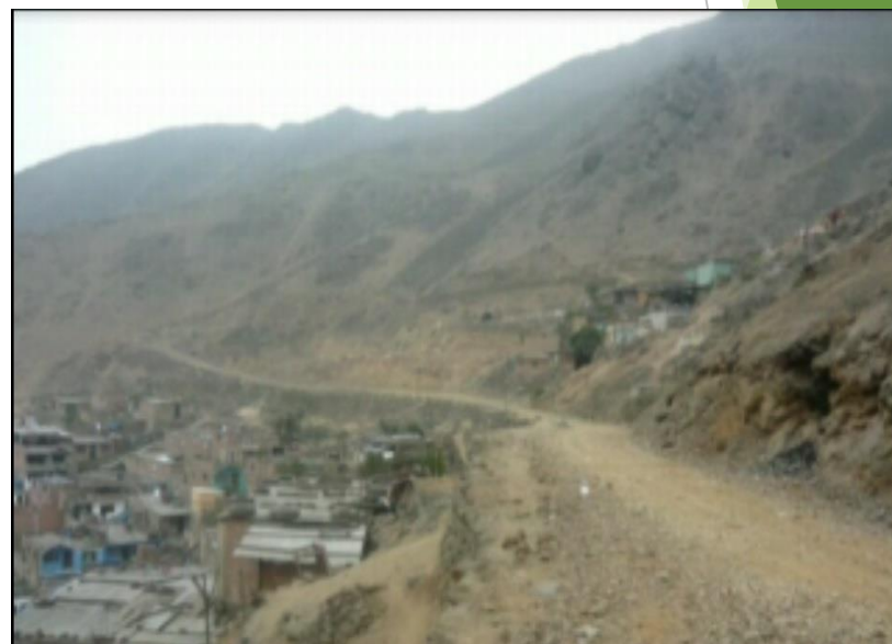
AV. VIA EXPRESA CERROS