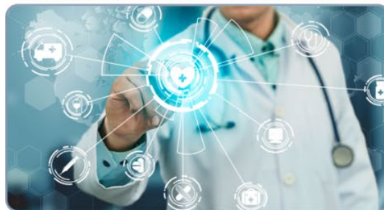
Factores de riesgo de las enfermedades no transmisibles