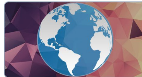
Migraciones y salud